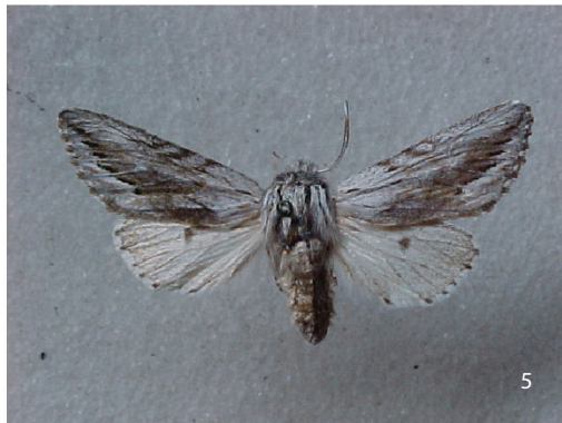
Fig. 1. Adulto Fototipo Argyrana excellens Koehler (ZSM); Fig. 2. Argyrana paulokehleri macho; Fig. 3. Argyrana paulokehleri hembra; Fig. 4. Argyrana bimorpha macho morfo; 1; Fig. 5. Argyrana bimorpha macho morfo 2.