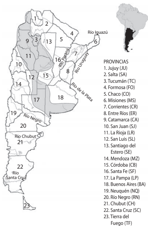
Fig. 1. República Argentina con los principales ríos y provincias. Área gris: Zona de Transición.