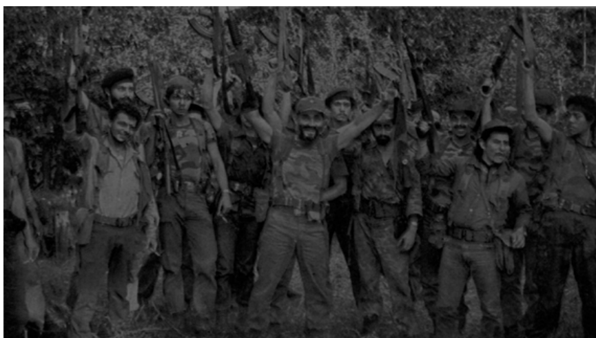
Figura 6. Fotografía de Edén Pastora y “sus guerrilleros” en el Frente Sur, por Mario Castillo, 1983.

La resonancia de estas ideas (verdadero sandinismo, mística revolucionaria, una lucha de campesinos y jóvenes) fue capturada por el lente del fotógrafo Mario Castillo. Sus fotografías fueron publicadas tanto en La Nación y en La República entre los días 17 y 20 de mayo de 1983. La mística revolucionaria y la hermandad en armas se visualizaron en imágenes que presentaban un regocijo y un espíritu de comunidad (ver Figura 6). Además, se presenta un contraste en relación con la dureza de las imágenes del Frente Norte, expuestas anteriormente, donde predominaban visualmente la sobriedad y la rigurosidad militar.