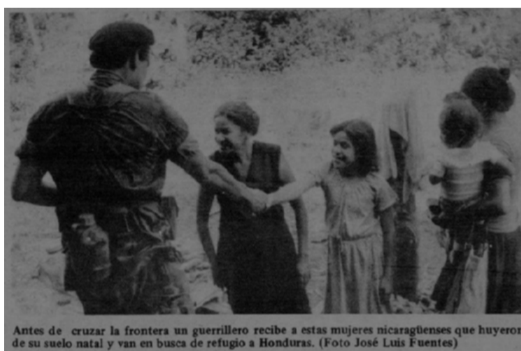
Figura 9. Fotografía de refugiados por José Luis Fuentes, 1983.

La fotografía que acompaña al reportaje presenta a mujeres campesinas estrechando la mano de un combatiente de la FARN, quien resguarda el camino de estas refugiadas (ver Figura 9). Imágenes como estas, mostraban a la Contra protegiendo a los desplazados, repartiendo alimentos a poblaciones campesinas o trasladando exiliados desde el río San Juan hacia Costa Rica 14 . Frente a la narrativa sandinista y sus simpatizantes costarricenses —que presentaban a los Contras con caracterizaciones monstruosas, donde las demostraciones de humanidad eran inconcebibles y los reducían a genocidas, asesinos o bestias (Agudelo, 2017)— estas fotografías buscaban cuestionar las construcciones deshumanizadoras aplicadas a los insurgentes.