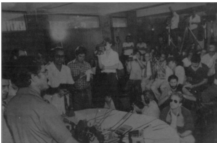
Figura 2. Conferencia de prensa de Edén Pastora, 15 de abril de 1982.

Su imagen como rebelde revolucionario, primero antisomocista y ahora contra los “traidores sandinistas”, fue aprovechada mediáticamente a través de incesantes conferencias de prensa, entrevistas y reportajes. La prensa, deseosa de obtener sus declaraciones, amplificó su figura. Escenas de Pastora rodeado de periodistas, como en la conferencia de prensa donde anunció su levantamiento armado (ver Figura 2), se volvieron comunes en la televisión y los diarios nacionales.