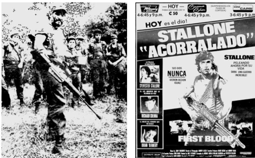
Figura 8. Fotografía de Edén Pastora por Mario Castillo (izq.) y afiche publicitario de la película Rambo (der.), 1983.

En este sentido, las fotografías en las que Pastora posaba con rifles y ametralladoras fueron mediatizadas para proyectar estos mensajes de fuerza. Estas imágenes resonaban con otras manifestaciones de la cultura visual de masas de la época, en particular con el cine de Hollywood de los años ochenta. En estas presentaciones cinematográficas, los valores como el consumismo, la masculinidad tradicional y el optimismo pos-Vietnam se integraban con la ideología armamentística y de los luchadores por la libertad promovida por la administración Reagan (Cousins, 2005; Nigra, 2017). Así, en sintonía con este espíritu de la época, un ejemplar de La Nación presentaba la fotografía del Comandante Cero con un arma pesada, tomada por Mario Castillo, junto a la publicidad de una de las películas emblemáticas del cine reaganista que encarnaba la ideología del periodo: Rambo (ver Figura ).