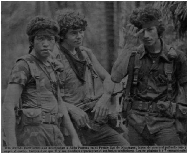
Figura 7. Fotografía de jóvenes guerrilleros de ARDE por Mario Castillo, 1983.

Por su parte, las fotografías de Mario Castillo visualizaban esta recuperación de la imagen de los “muchachos”. En estas se muestran a jóvenes guerrilleros posando con sus armas, retratados con gestualidad orgullosa y segura. Sus miradas desdeñan el lente y, por extensión, la mirada del espectador (ver Figura 7). Muchas de estas fotografías también muestran la simbología sandinista: el uso de las pañoletas rojo y negras es ahora reapropiado con las siglas de ARDE. La idea del “verdadero sandinismo” que Pastora reclamaba para su movimiento armado era reivindicada visualmente por sus guerrilleros y enfocada por los fotógrafos. En otras palabras, los encuadres reforzaban la narrativa de los “verdaderos sandinistas” e invisibilizaban a otros combatientes que no compartían ni ideológica ni visualmente con estos aliados de dudosa procedencia.