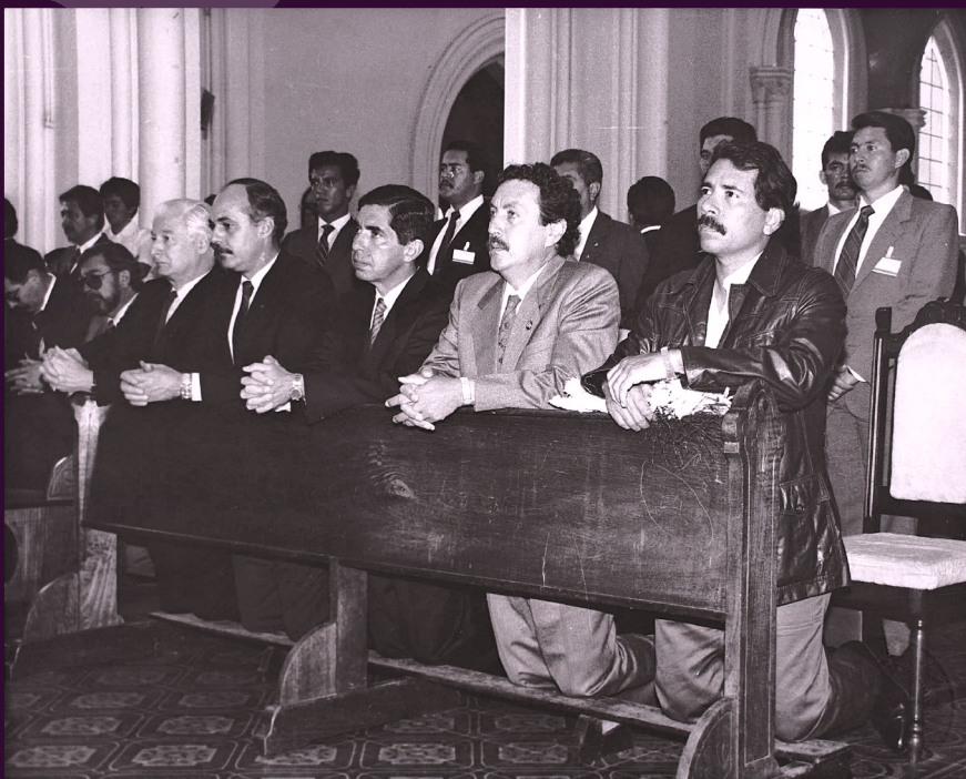
Presidentes de Centroamérica: José Azeona, Alfredo Cristiani, Oscar Arias, Vinicio Cerezo, Daniel Ortega, hincados en un reclinatorio, durante un acto religioso celebrado en la iglesia de San Isidro de Coronado, San José, Costa Rica.