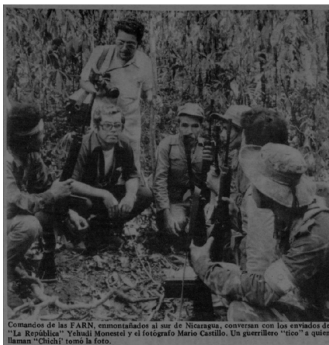
Figura 3. Fotografía de guerrilleros del FARN junto con periodistas y fotógrafos de La República , 1983.

Nota. Tomado de Comandos antisandinistas hablan al sur de Nicaragua , por Y. Monestel, 1983a, La República , p. 11.