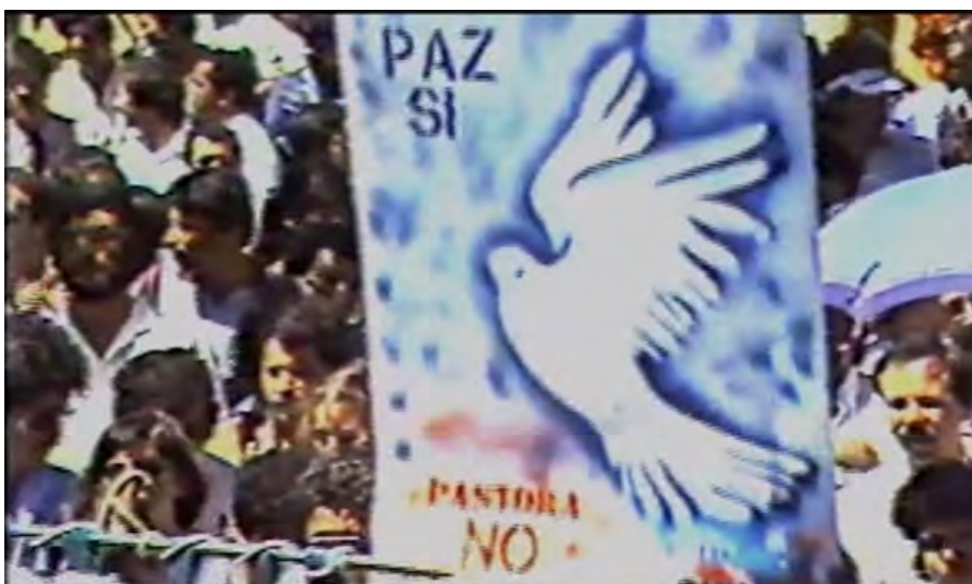
Figura 11. Pancarta contra Edén Pastora en la Marcha de la Neutralidad, 15 de mayo de 1984.

En ese contexto, circularon nuevos marcos simbólicos y visuales centrados en la paz, que contrastaban con la iconografía guerrillera de los Contras. Una de las pancartas de esa marcha portaba el símbolo por antonomasia de la paz: la paloma blanca, acompañada del lema: “Paz sí, Pastora no” (ver Figura 11). Esta consigna sintetizó el rechazo tanto a la militarización regional como a la figura de Edén Pastora, quien había pasado de ser un ícono revolucionario a un representante de la violencia fronteriza. Así, la imagen de la revolución nicaragüense, reconvertida en rostro público de la Contra, fue simbólicamente desplazado por figuras colectivas de la paz.