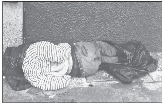
Foto 3. Las personas que viven en la indigencia duermen en las aceras de la capital.