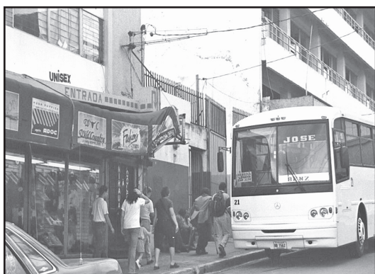
Foto 1. La Zona Noroeste del casco metropolitano concentra varios locales comerciales y paradas de autobuses, por lo cual es transitada por muchas personas y sitio de indigentes.

Fuente: Trabajo de terreno Carolina Rojas Madrigal. Cartografía digital: Sofía Artavia.