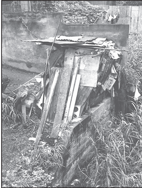
Foto 2. Los lotes y casas abandonadas son utilizados por las personas en indigencia para construir "ranchos" con material de desecho.

Estos rasgos de la “Zona Roja” implican posibilidades para la supervivencia de estas personas, en condiciones altamente peligrosas y precarias que perjudican su salud mental y física.