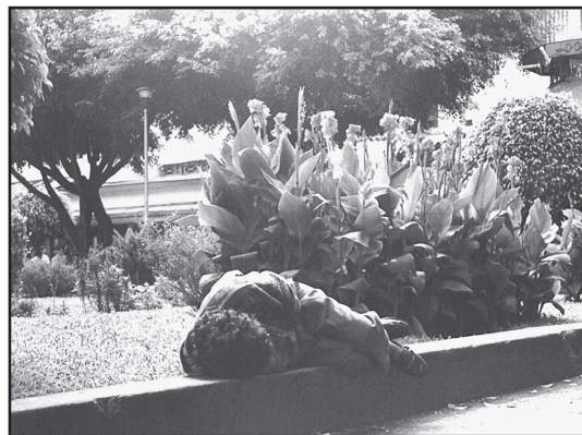
Foto 4. Algunas personas en indigencia presentan la imagen clásica de un mendigo; otras pueden confundirse con cualquier transeúnte.