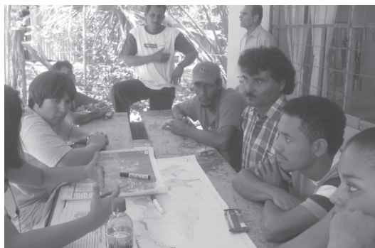
Fotografía 8 Trabajo con mapas durante las reuniones de propuestas, Bocana.