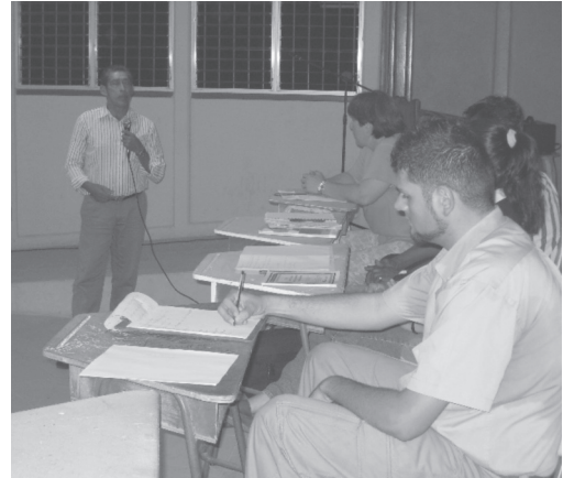
Fotografía 1 y 2

Presentación oficial del equipo de investigación.