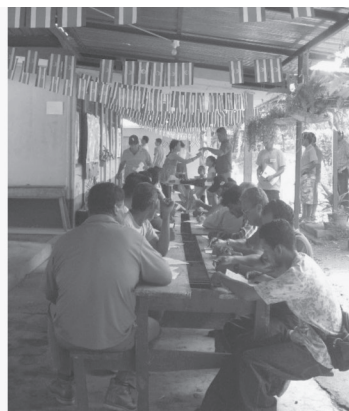
Fotografía 5 y 6 Reuniones en la comunidad de Jicaro y Bocana.

Como parte de los resultados obtenidos se clasificaron las opiniones en categorías que agruparan las opiniones de los participantes, de esta manera se generaron las categorías generales de vinculantes o no con el proyecto Plan Regulador y cada uno de estos se dividen en las siguientes sub categorías: actividades productivas, áreas recreativas y espacios públicos, zonas para reubicación de los pobladores que estén en la zona pública, zona institucional y centros de acopio o mercado para pescadores.