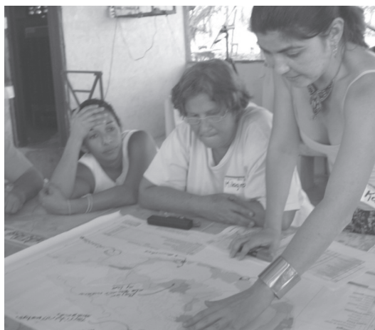
Fotografía 7 Trabajo con mapas durante las reuniones de propuestas. Comunidad de San Antonio, 2009.

En la figura 3 presenta el mapa de zonificación del Plan Regulador antes y después de realizadas las reuniones de prepropuestas con los vecinos de la isla.