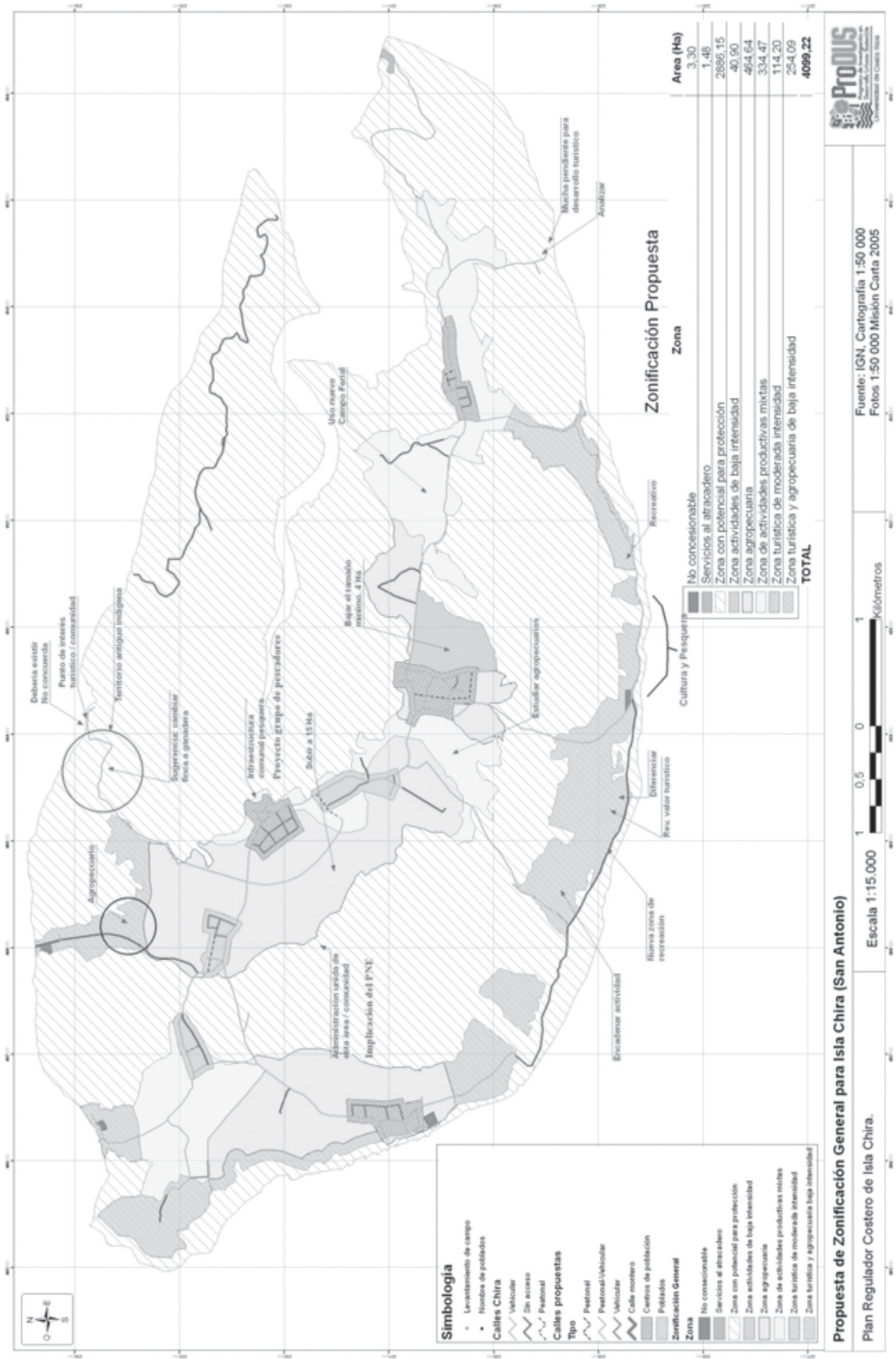
Figura 3 Mapas de zonificación antes y después de las reuniones de Preprouestas.