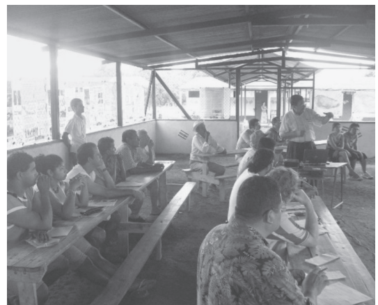
Fotografía 3 y 4

Reuniones en la comunidad de Palito y San Antonio.