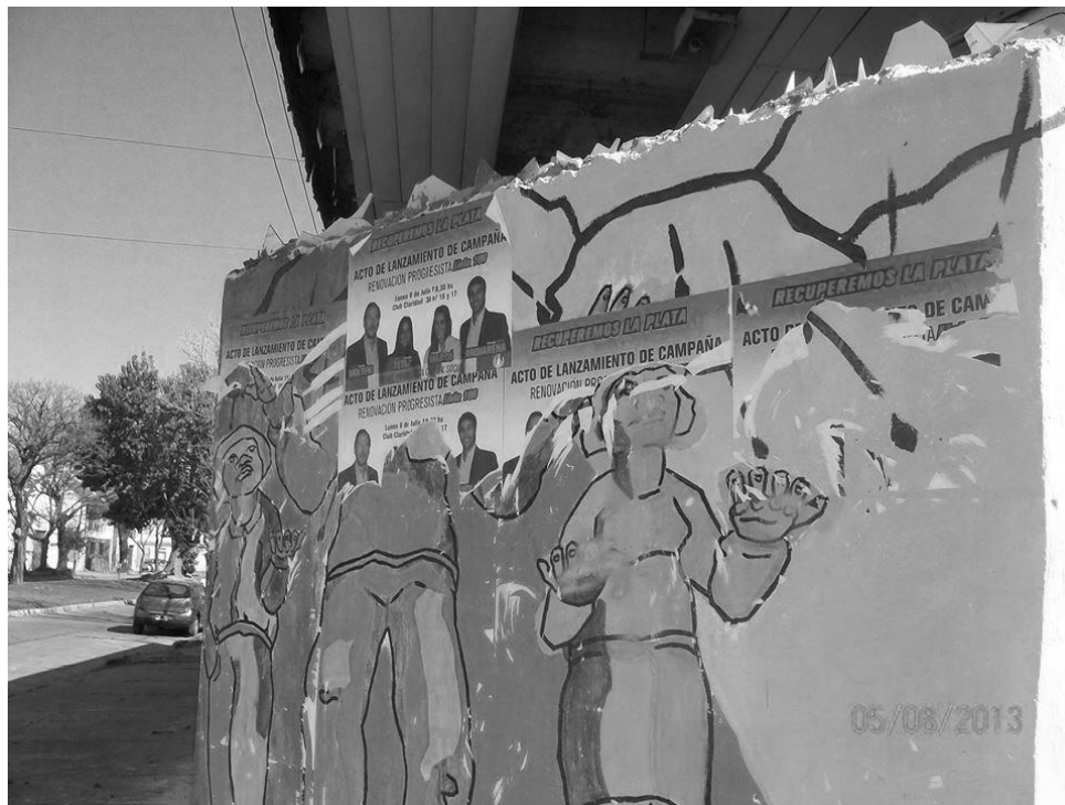
Figura 5: Mural de 26 y 66 tapado con afiches del Frente Progresista Cívico y Social, agosto de 2013