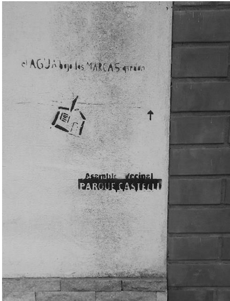
Figura 3: Asamblea Vecinal Parque Castelli

Luego se hicieron los murales, realizados en paredes cedidas por sus dueños, ya sean de viviendas particulares o de áreas comerciales, todos emplazados en espacios inundados. Es interesante reponer cómo era el espacio previo a la inundación y quién tenía acceso a su uso, pues ello nos aporta información para pensar su disputa y la construcción de la historia sobre lo que allí sucedió tras la catástrofe. En este sentido, analizaremos esta disputa en tanto proceso, identificando diferentes momentos en la reapropiación y reconfiguración del espacio.