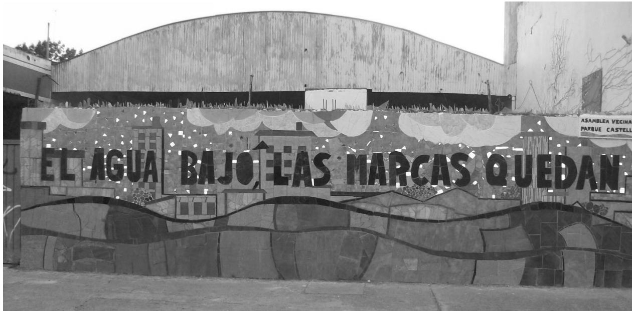
Figura 7: Mural de 26 y 66 en técnica mosaico, 2013

el espacio de la calle y el Parque, generando una propuesta que pretendía involucrar a otros vecinos del barrio y a los transeúntes ocasionales.