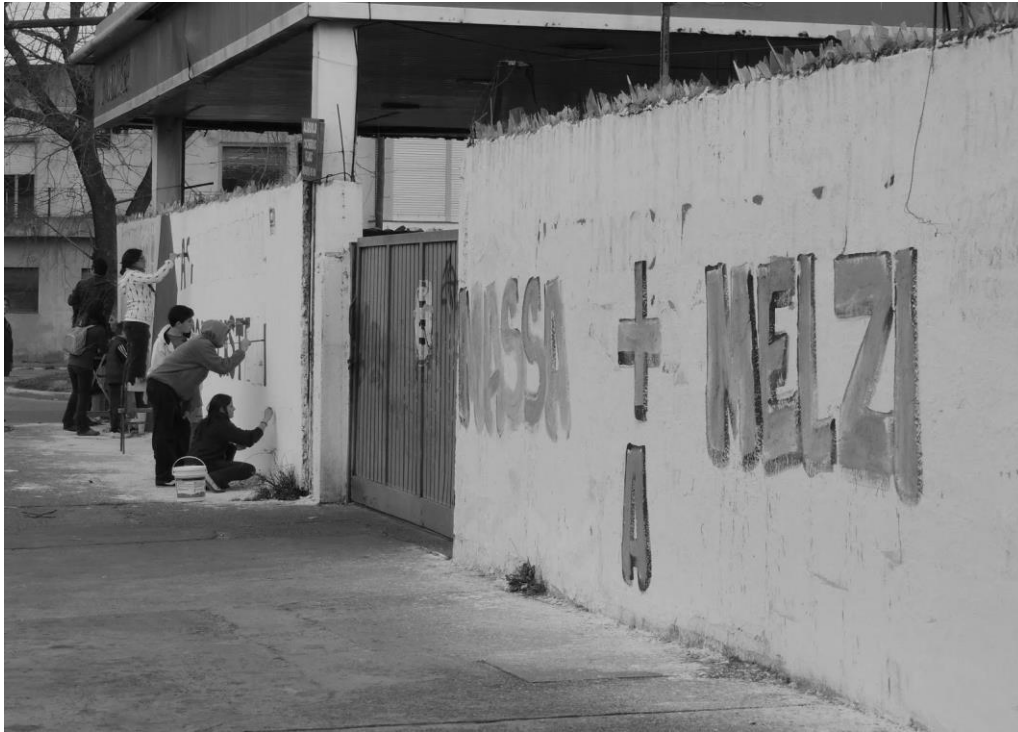
Figura 4: Mural de 26 y 66 tapado con las inscripciones Massa – Melzi, agosto de 2013

afiches. En este caso, Melzi era uno de los referentes de Massa en La Plata. Frente a esta situación, el cuarto momento supuso que el día domingo de ese fin de semana la Asamblea volviera a repintar el mural.