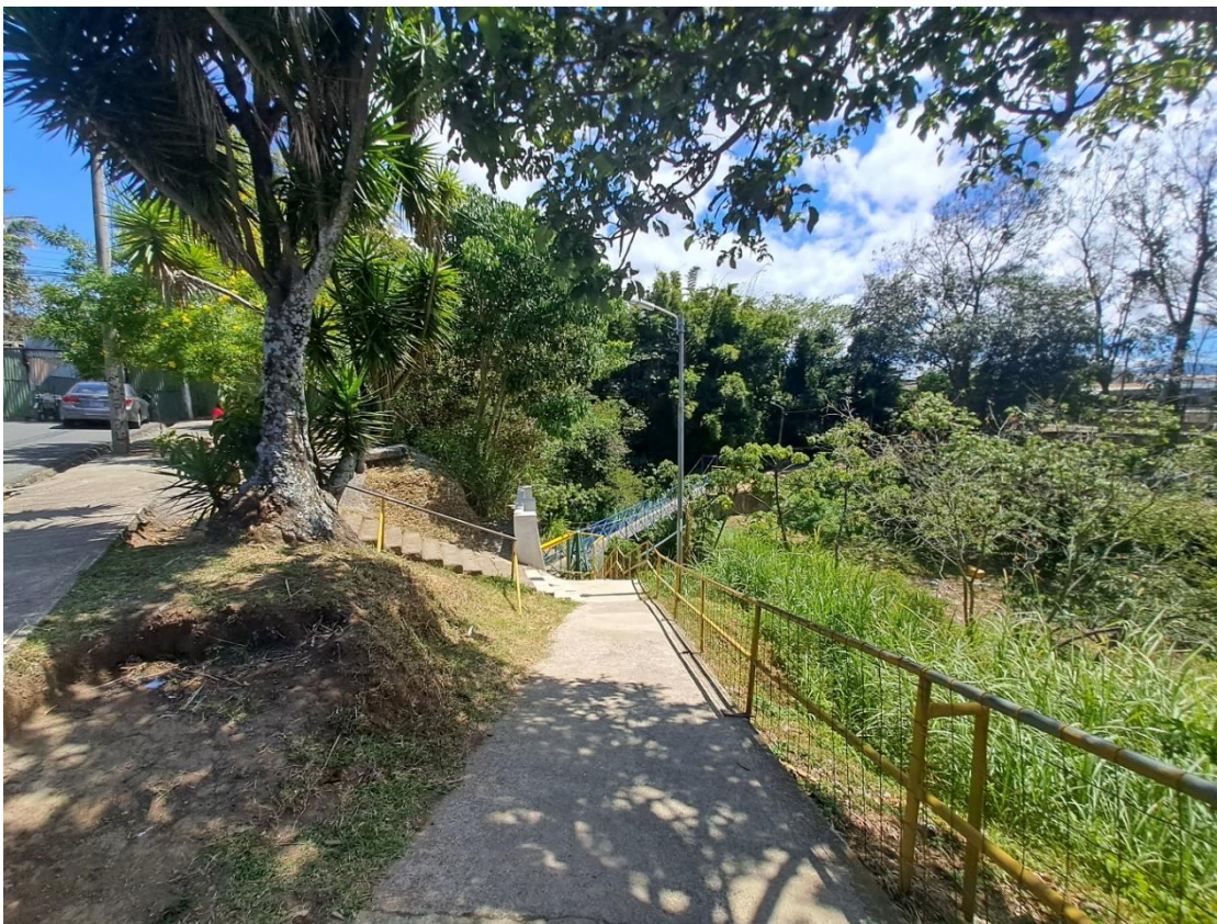
Figura 3. Fotografía del puente entre Guararí y Los Lagos.

discapacidad para trasladarse, él va a tener dificultades, ya que no hay rampas» (Todas las entrevistas fueron confidenciales y los nombres de los entrevistados se han ocultado por mutuo acuerdo, octubre 2022). El puente en cuestión se muestra en la Figura 3.