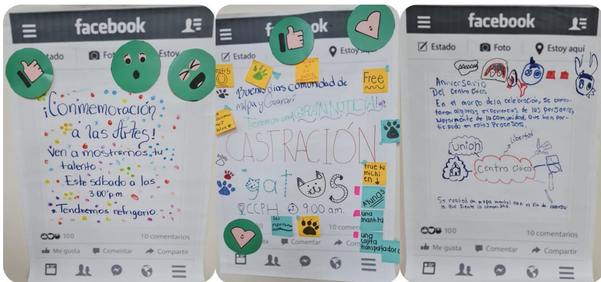
Figura 2. Fotografías de las noticias discutidas durante los talleres 2022

Estos son algunos aspectos que forman parte de la subjetividad, en este caso, para diferenciarse de algunos imaginarios frecuentes sobre espacio en que estas se desenvuelven. En este caso hay una toma de distancia con imaginarios peyorativos sobre el lugar (Figura 2).