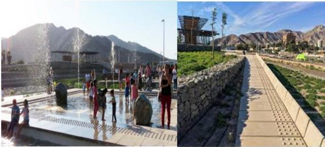
Figura 3. Piletas de agua y borde ribereño del parque Kaukari