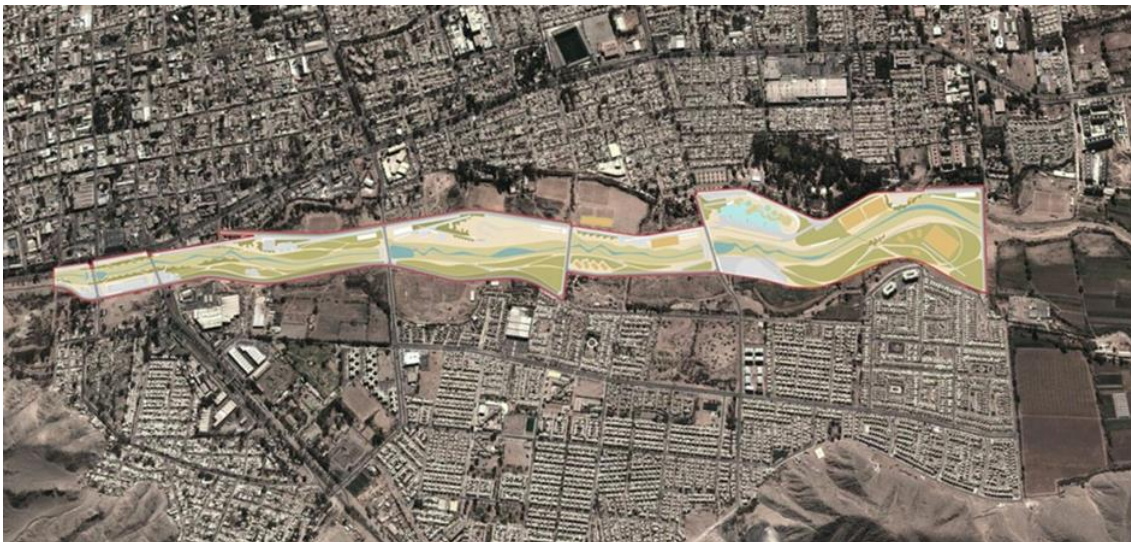
Figura 2. Plano del sector de la comuna de Copiapó que comprende el Parque Kaukari, (destacado en colores el área total del parque)