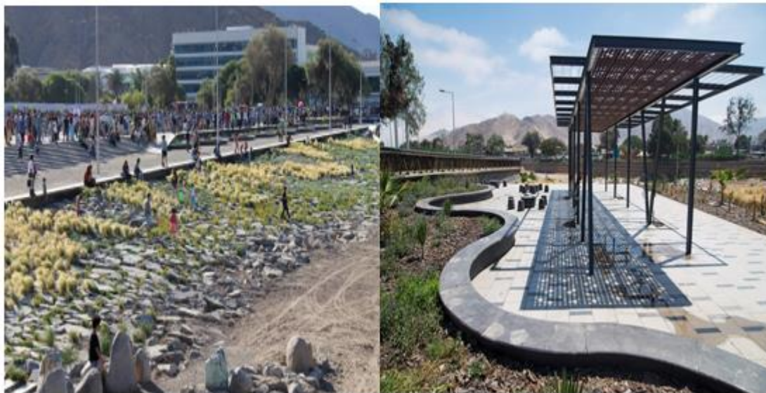
Figura 4. Parque Kaukari