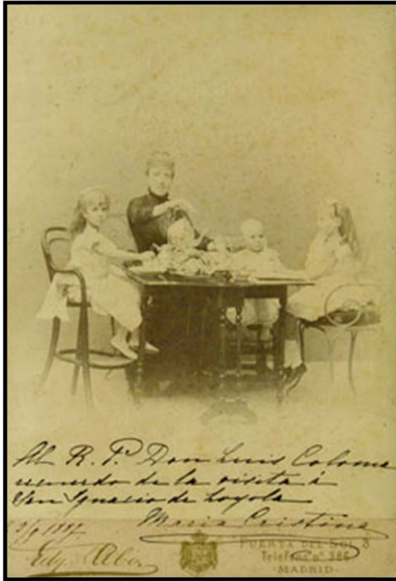
Imagen 4 Reina María Cristina y sus hijos con dedicatoria autógrafa al Padre Luis Coloma