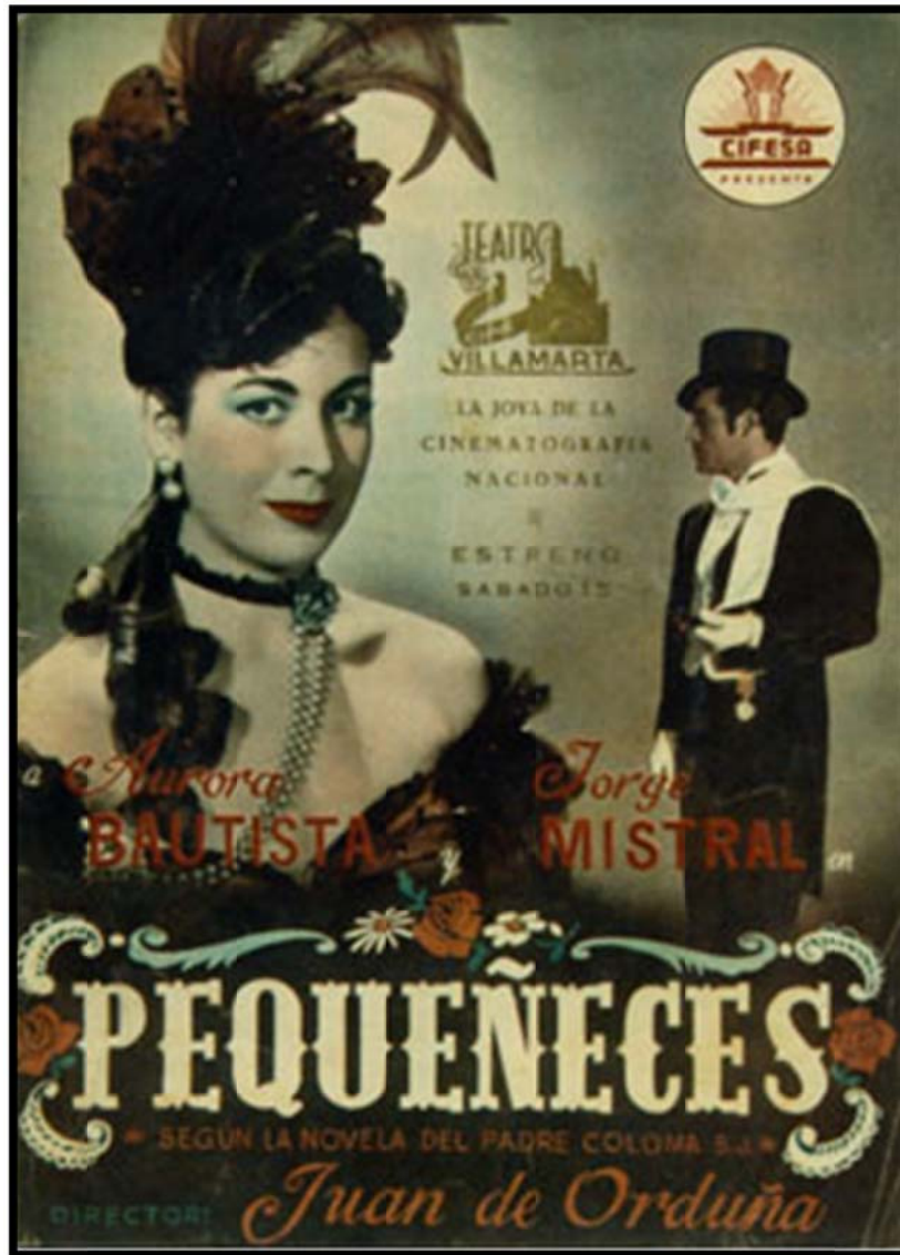
Imagen 2 Cartel de la película Pequeñeces (1950)