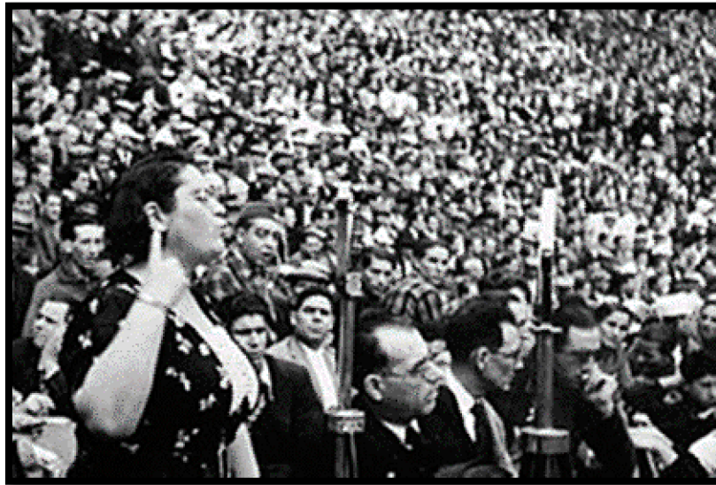
Imagen 5 Federica Montseny en un Miting de la CNT a la Plaça Monumental, 19 de julio 1936