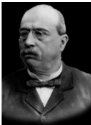
Miguel Morayta y Sagrario

Morayta defendía y apoyaba el asimilismo, la representación en las Cortes y una serie de reformas liberalizadoras que, dado su marcado carácter anticlerical, tendían a restringir la preponderancia de las órdenes religiosas. Algo que, perfectamente, podía haber sido el programa del Partido Asimilista de Filipinas, si este hubiera llegado a materializarse, como ocurrió en Cuba. Morayta nunca soportó ideas autonomistas y mucho menos separatistas, pero acabó convertido, casi más que Del Pilar y los otros, en -la cabeza visible de las aspiraciones filipinas debido a todos los trabajos realizados en el ámbito periodístico y en el del poder.