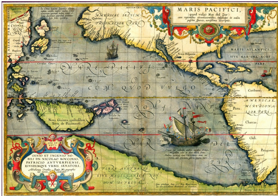
MAPA DE 1589 DEL OCÉANO PACÍFICO, DE ABRAHAM ORTELIUS, CON LA NAO VICTORIA

En este trabajo pretendemos aproximarnos a la creación del gran movimiento asociativo que es la masonería, en un espacio que se desplaza del área de Latinoamérica y el Caribe al Pacífico español, territorio incluido en el Virreinato de Nueva España, que en 2019 conmemoró el V Centenario de la Primera Vuelta al Mundo. Nos ubicaremos en Filipinas, ese lugar tan desconocido como olvidado en la historiografía española.