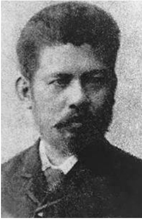
Marcelo Hilario Del Pilar

En este contexto de activa propaganda, Graciano López Jaena y el escritor y periodista Marcelo Hilario del Pilar, idean la creación de la Asociación Hispano-Filipina, sociedad teóricamente desvinculada de la masonería, cuyo fin era recabar apoyos de cualquier tipo para la causa filipina pero, sobre todo, para debilitar el poder del clero.