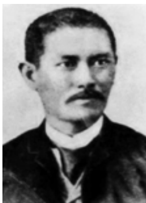
Graciano López Jaena

El siguiente episodio de los filipinos en la masonería española ocurrió dos años después, en 1889. El 2 de abril de ese año, reunido en Barcelona, en la Rambla de Canaletas no. 2, 3 o , un grupo de masones decidieron organizar una nueva logia casi exclusivamente de filipinos y solicitar la carta constitutiva al recién creado GOE, presidido por Morayta. La nueva entidad así formada era la logia Revolución , registrada con el no. 65 12 .