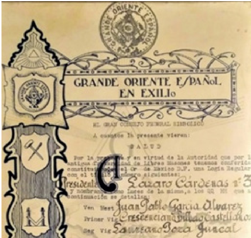
Foto 3.- Logia Lázaro Cárdenas número 3 del GOE. Detalle, Carta Patente, 24 de febrero de 1943 39