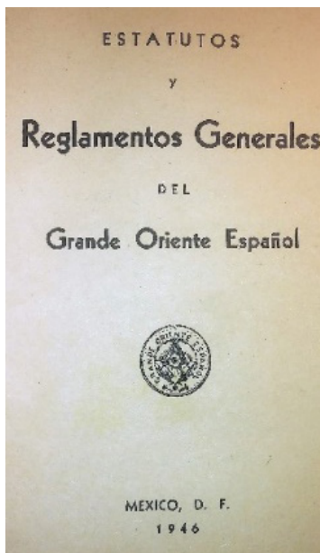
Foto 1.- Portada interna.

Con ello, el GOE constituyó la logia Presidente Lázaro Cárdenas número 3, en la Ciudad de México, Distrito Federal. Con la Carta Patente autorizó a sus dirigentes reclutar miembros, concederles grados y afiliarse a masones 34 . Todo conforme con el Rito Escocés Antiguo y Aceptado y sus normas. En México, el GOE trabajó para lograr la primera impresión de sus normas positivas en el exilio entre 1946 y 1947 35 .