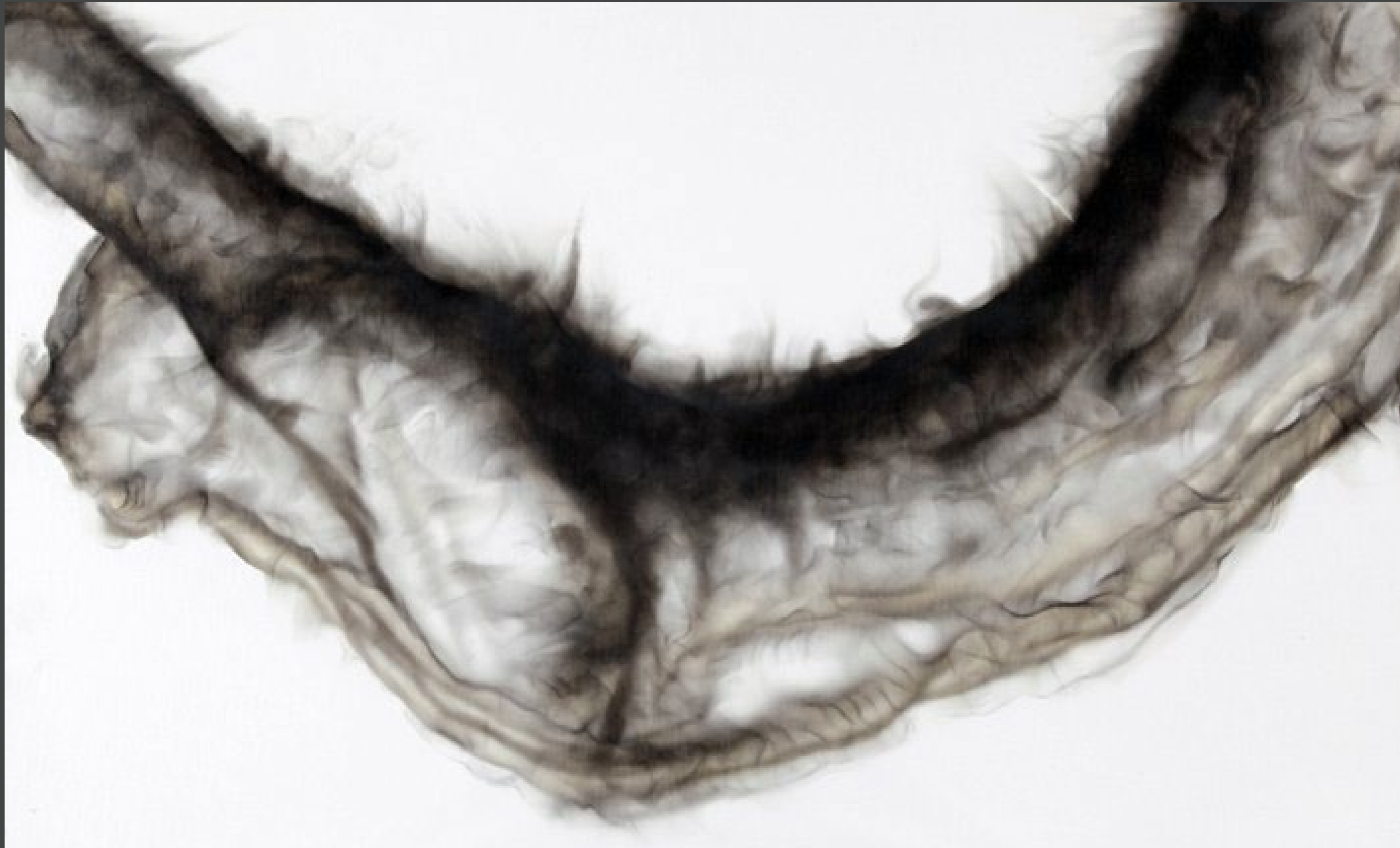
CONCAVO Y CONVEXO (2) 2011 Díptico Humo y pincel seco sobre tela. 76x122cms.