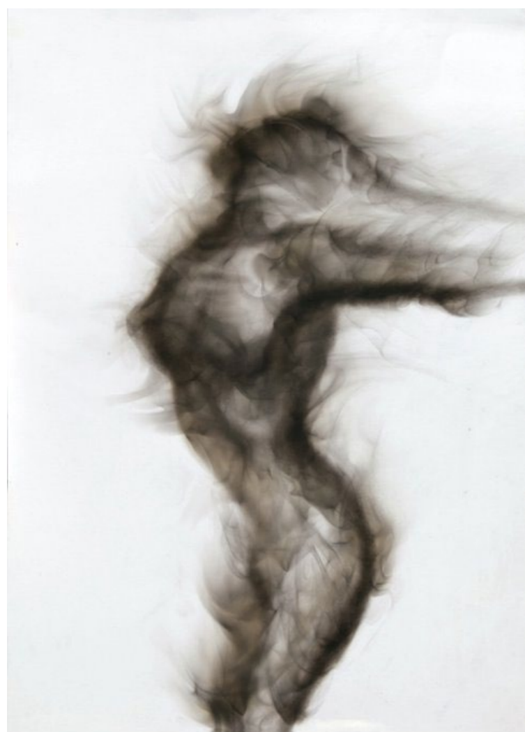
MUJER DE HUMO I 2011 Humo y pincel seco sobre papel. 70x50cms.