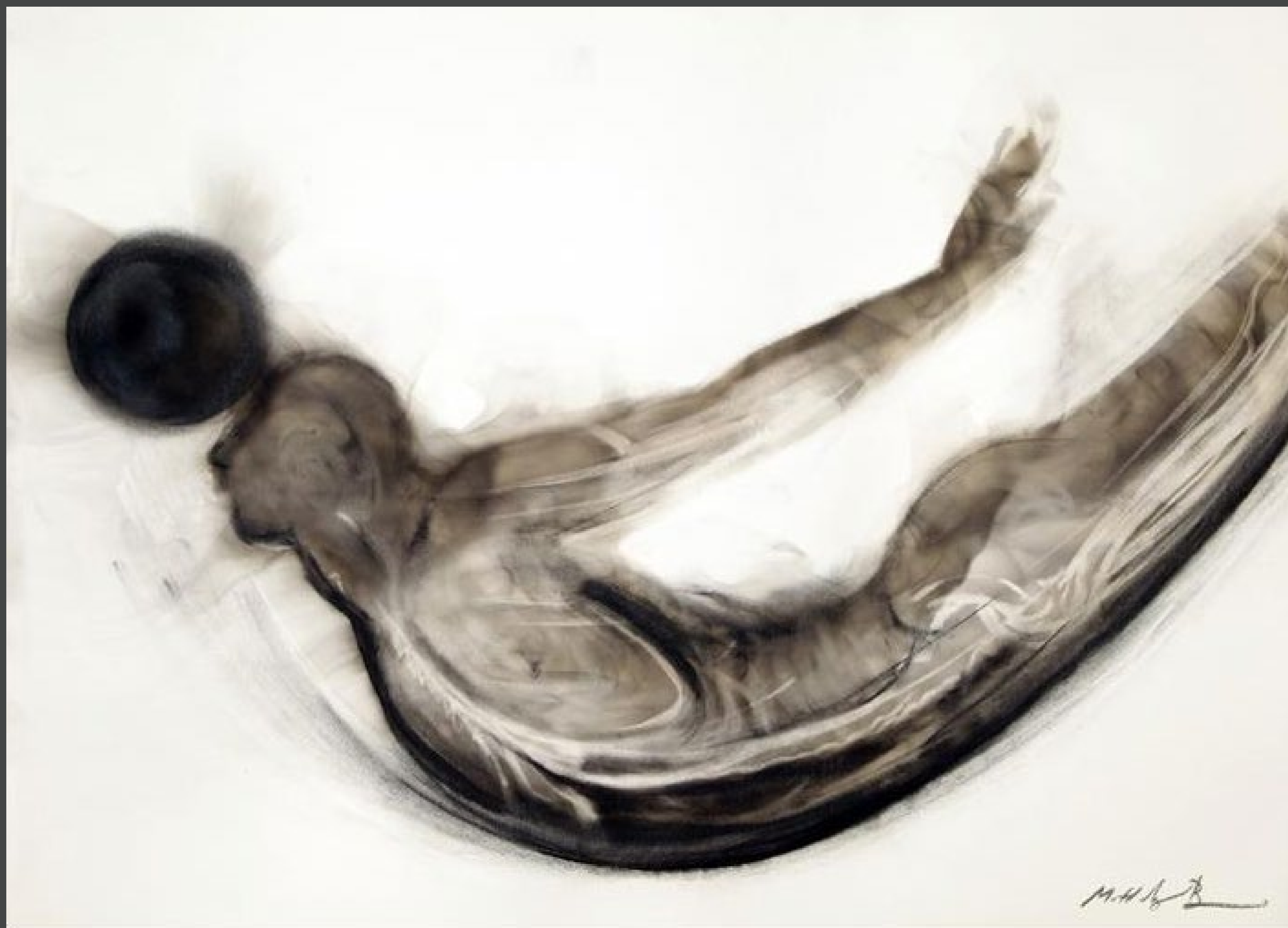
JUEGO I 2012 Humo, pincel seco y carboncillo sobre papel 50x70cms