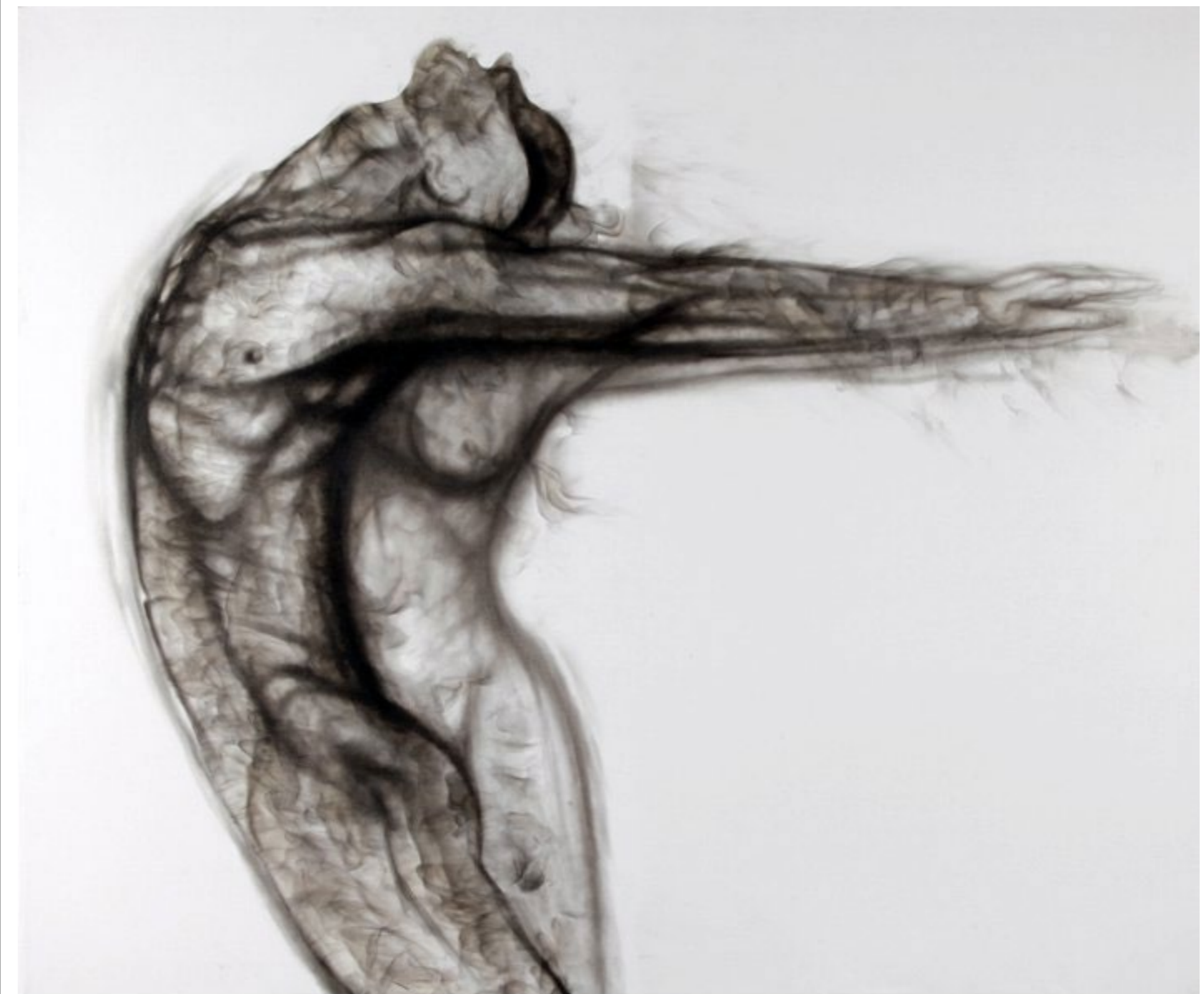
DANZA ATEMPORA 2011 Humo, pincel seco y sobre tela. 150x180cms.

Las superficies cromáticas y gráficas conseguidas con este tratamiento