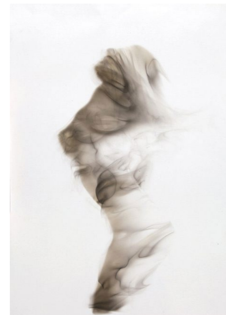
MUJER DE HUMO V 2011 Humo y pincel seco sobre papel. 70x50cms.