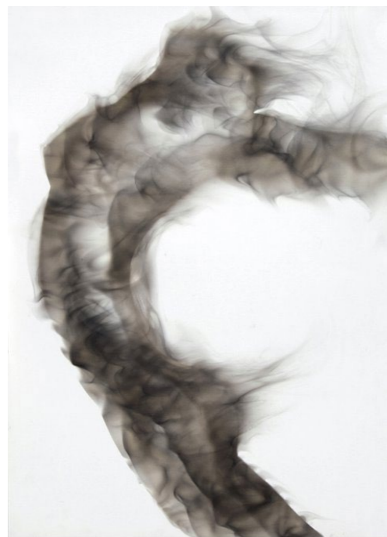
MUJER DE HUMO II 2011 Humo y pincel seco sobre papel. 70x50cms.