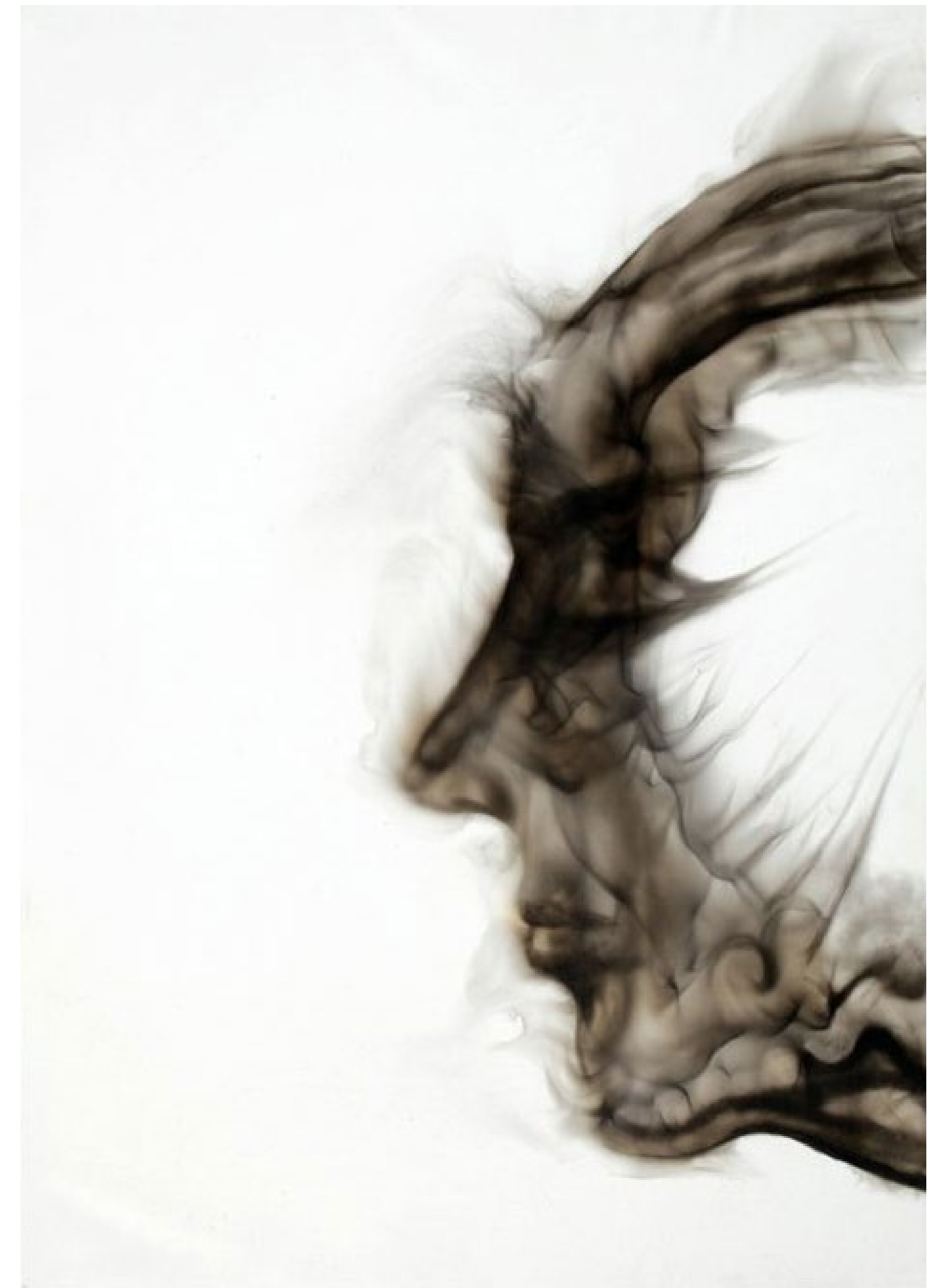
PERFIL DE LA MUSA II 2011 Humo y pincel seco sobre tela sintética. 100x70cms. Fotografía RRubí (abr-2011)

En los inicios de su carrera esta imagen del cuerpo, símbolo de la posición del hombre en los humanismos tradicionales, fue sometida por Hernández a contextos y espacios plásticos que de alguna manera cuestionaban ese lugar de privilegio de una concepción idealizada de lo humano. Sus personajes, desplazados en vertiginosas carreras, caían contra el suelo al final de la gesta heroica, y toda su extraordinaria belleza se desplomaba con ellos. La condición ideal de sus torsos atravesaba barreras e impedimentos que connotaban lucha y ruptura.