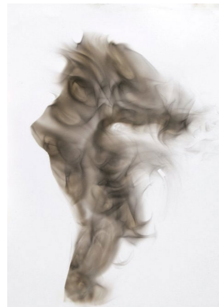
MUJER DE HUMO IV 2011 Humo y pincel seco sobre papel. 70x50cms.