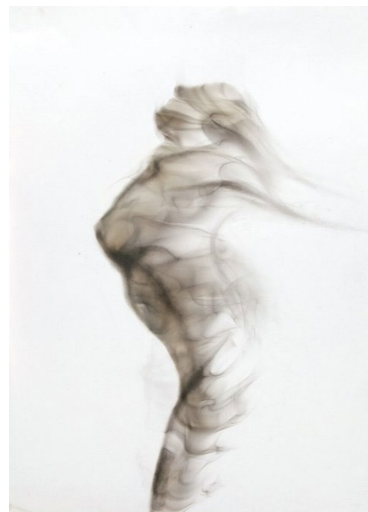
MUJER DE HUMO III 2011 Humo y pincel seco sobre papel. 70x50cms.