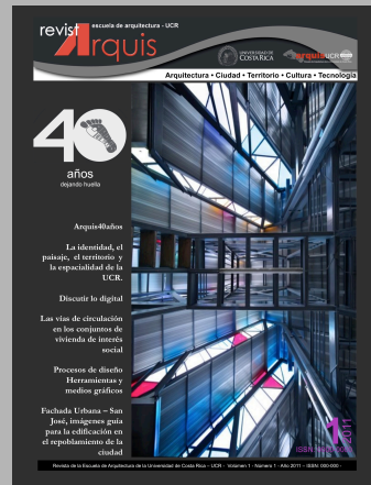
Portada: Imagen base, edificio Escuela de Arquitectura (5to piso), UCR., arq. Edgar Brenes.

El idioma principal es el español y, como segundo, el inglés.