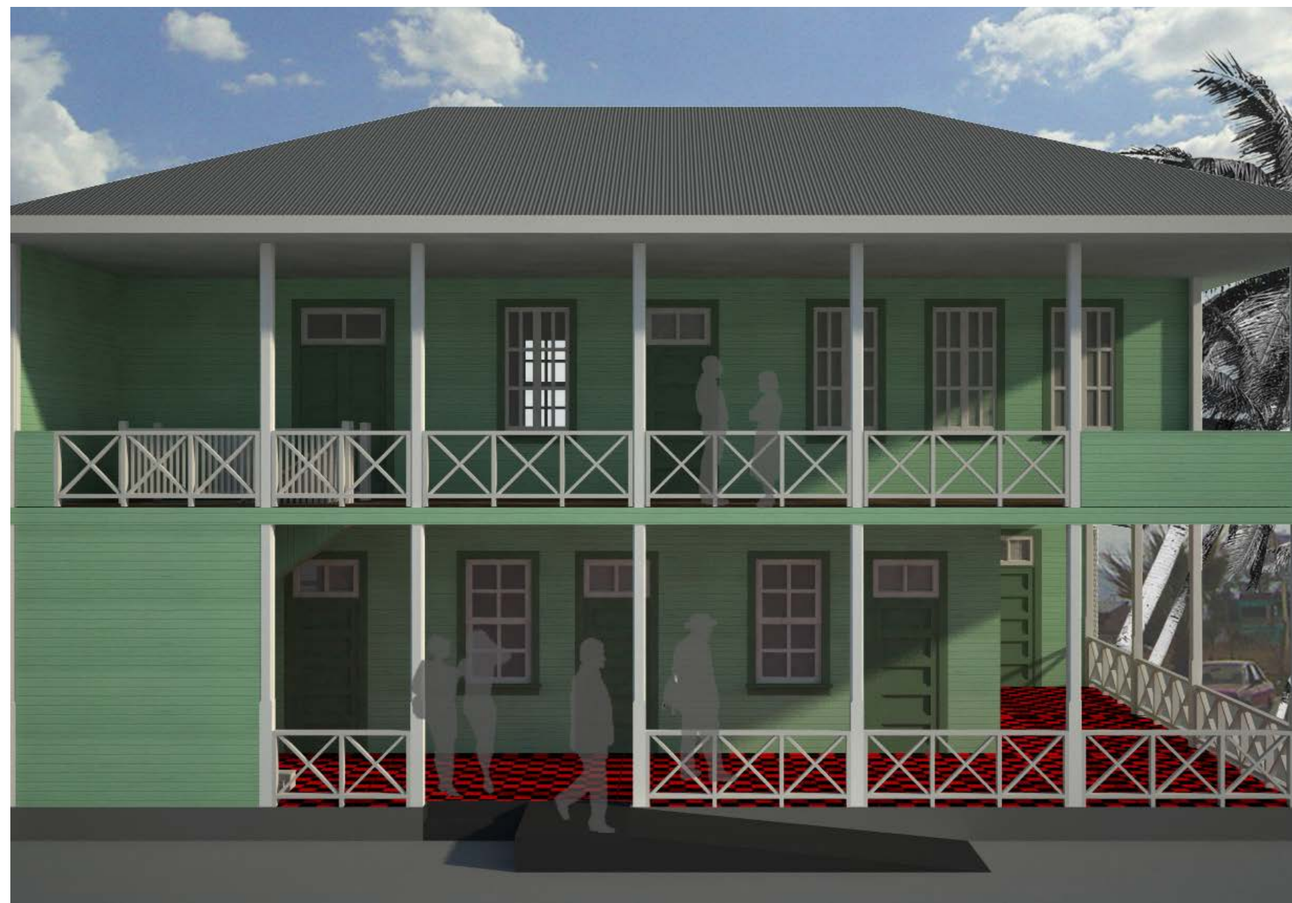
Imagen 7. Vista externa de la propuesta para la restauración del edificio