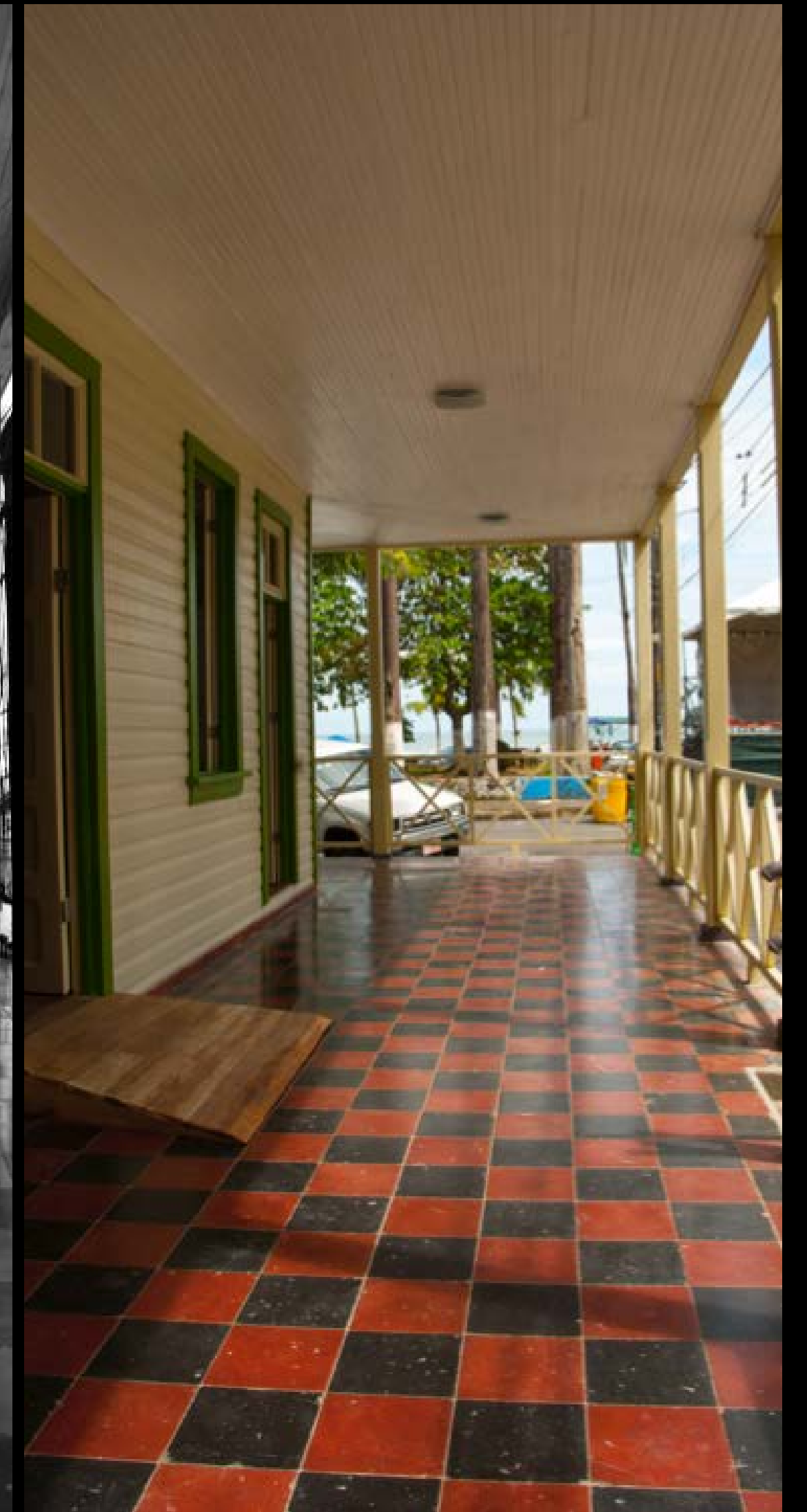
Imagen 13 y 14 . Vista del corredor del segundo nivel, antes y después de la restauración