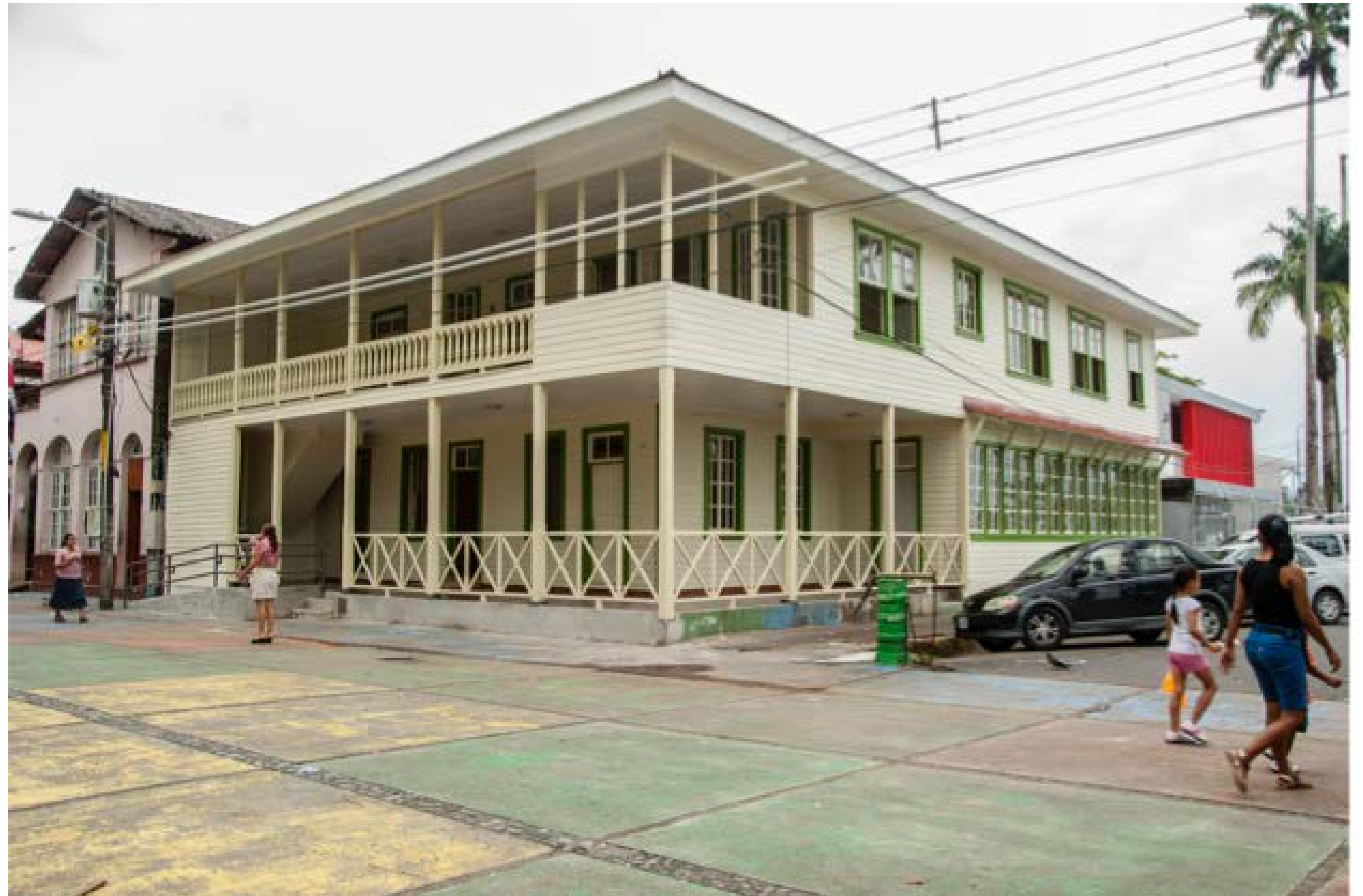
Imagen 19. Vista Externa del edificio restaurado.