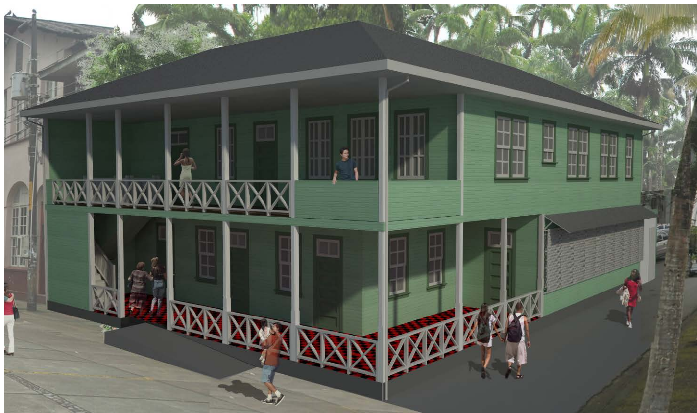
Imagen 17. Vista Externa del edificio deteriorado. Imagen 18. Vista Externa digital de la propuesta.