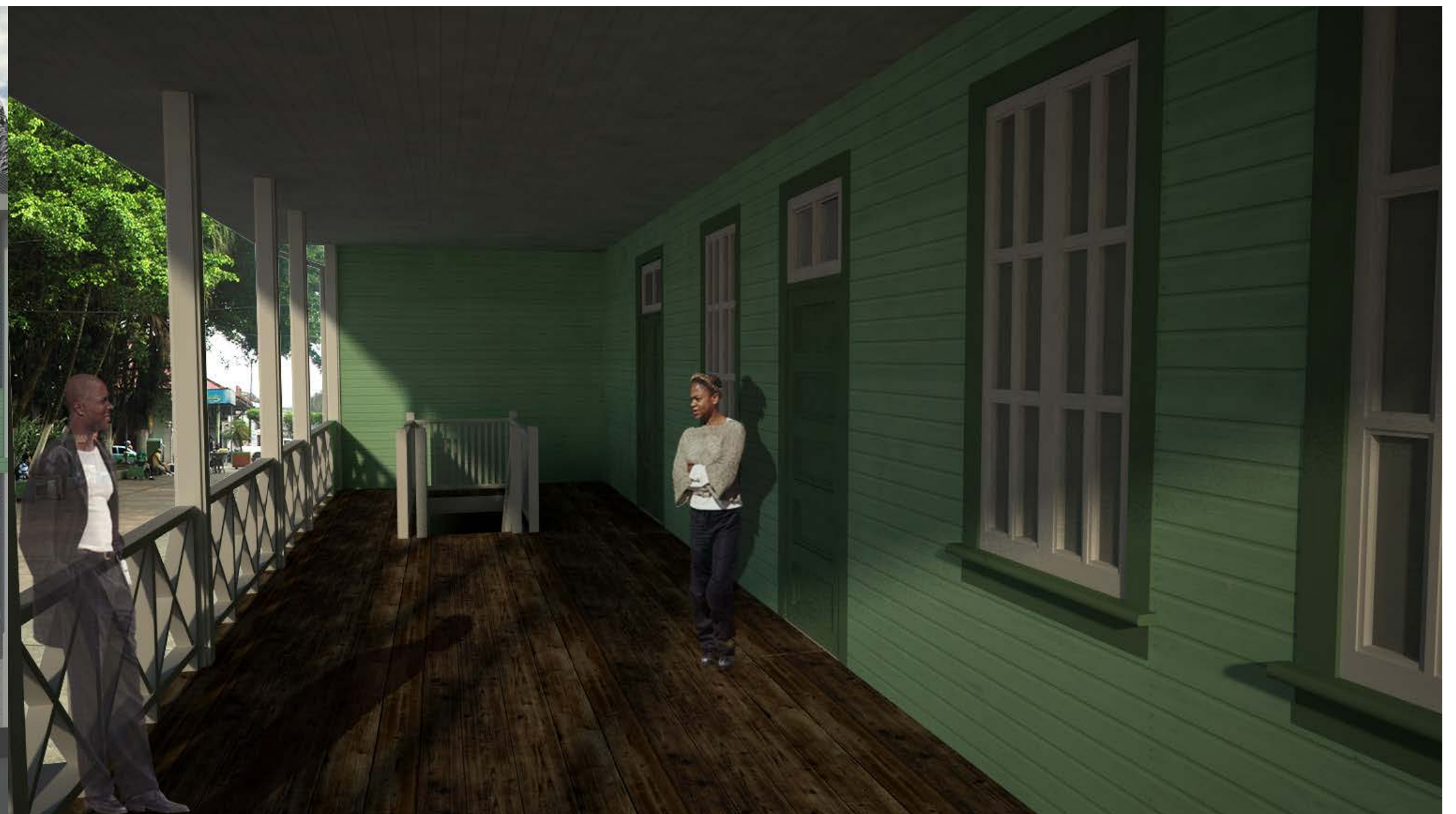
Imagen 8. Vista del balcón de la propuesta para la restauración del edificio