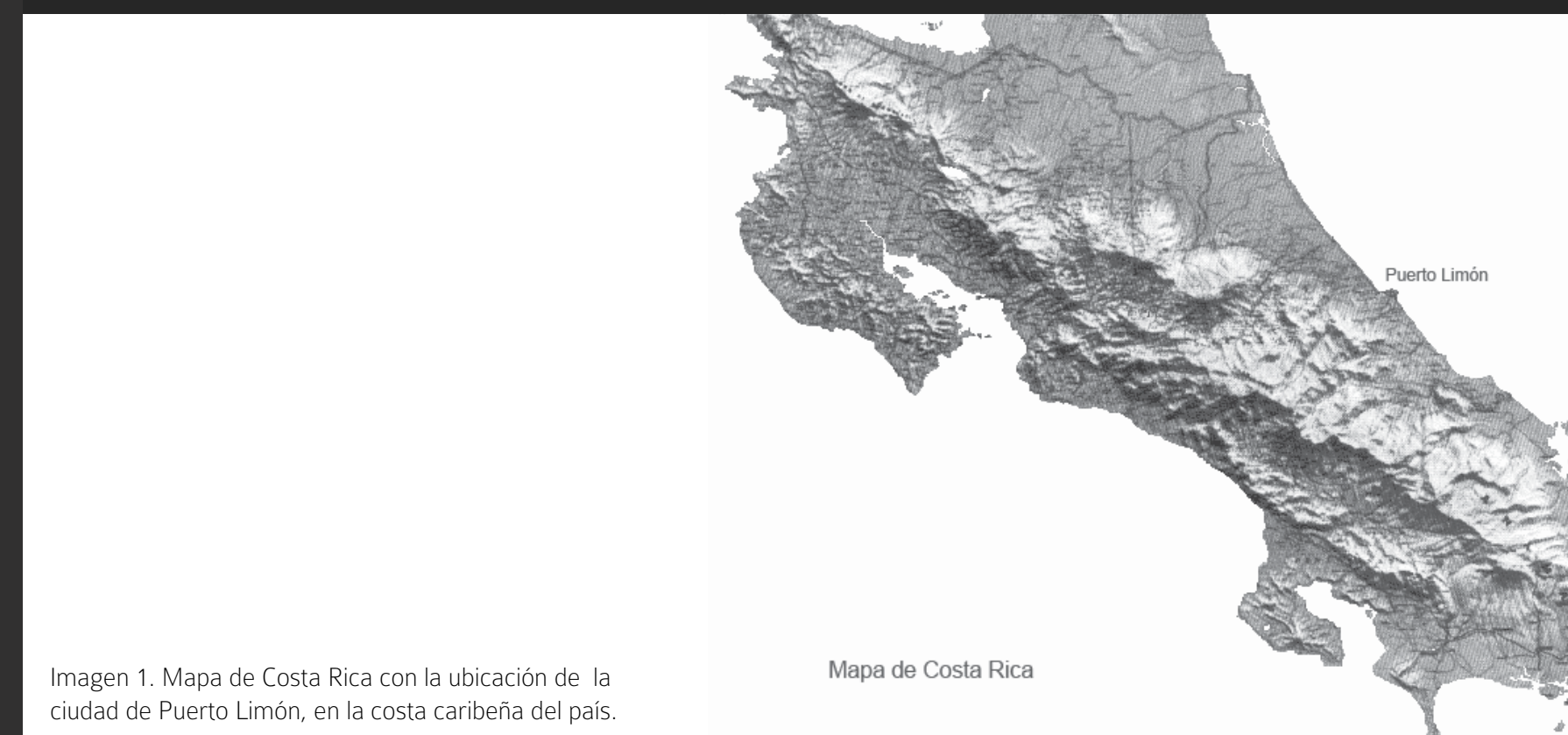
Imagen 1. Mapa de Costa Rica con la ubicación de la ciudad de Puerto Limón, en la costa caribeña del país.

Con el aporte económico del Centro de Investigación y Conservación del Patrimonio Cultural, se llevó a cabo la restauración del edificio Antigua Capitanía de Puerto, en el 2014.