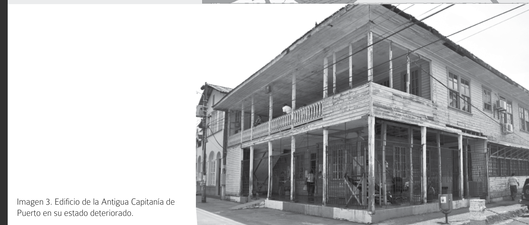
Imagen 3. Edificio de la Antigua Capitanía de Puerto en su estado deteriorado.