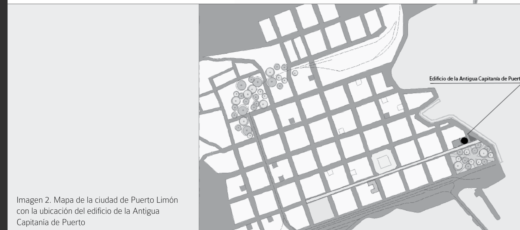
Imagen 2. Mapa de la ciudad de Puerto Limón con la ubicación del edificio de la Antigua Capitanía de Puerto