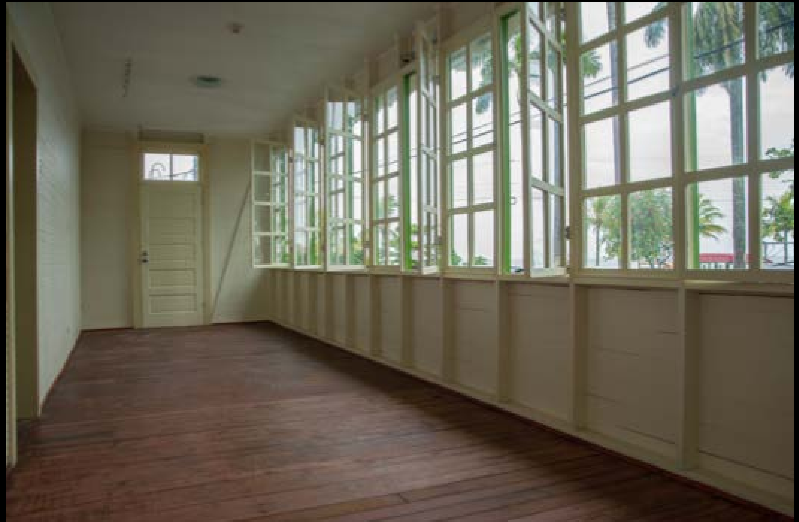
Imagen 9 y 10 . Vistas internas del segundo nivel, antes y después de la restauración