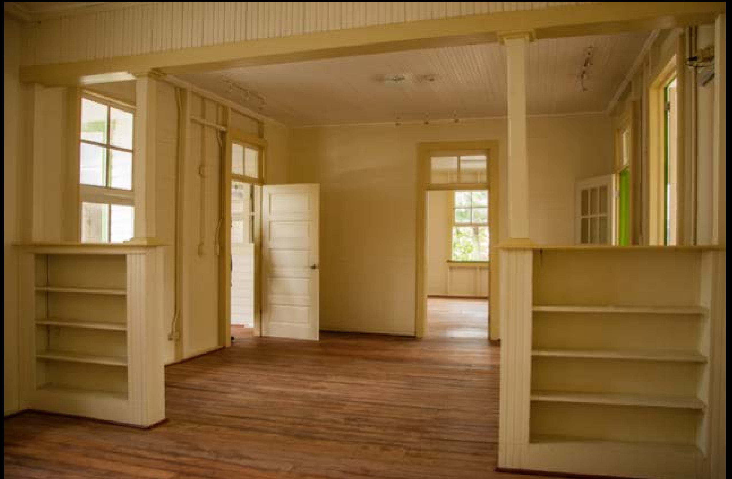
Imagen 11 y 12. Vistas internas, antes y después de la restauración