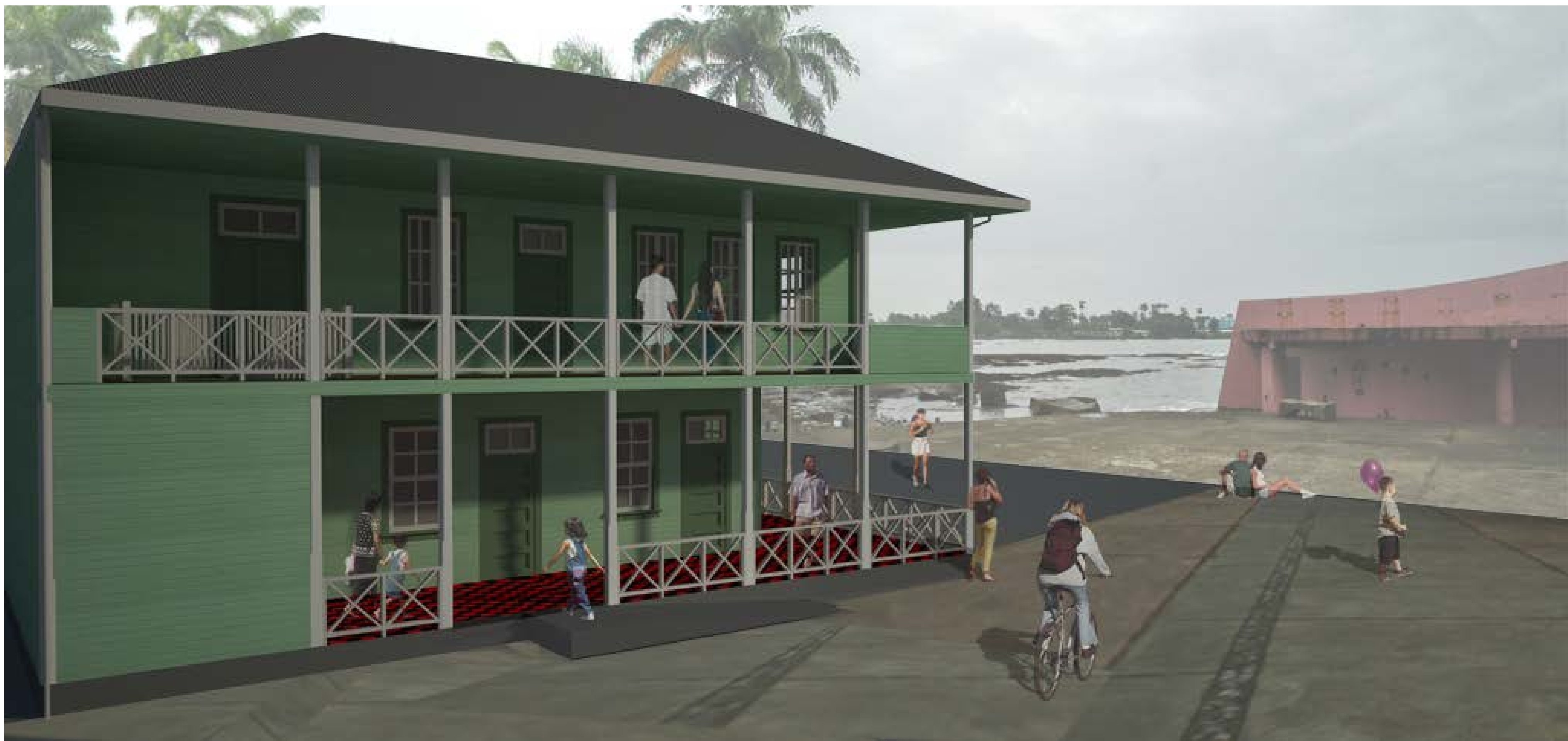
Imagen 6. Vista externa de la propuesta para la restauración del edificio