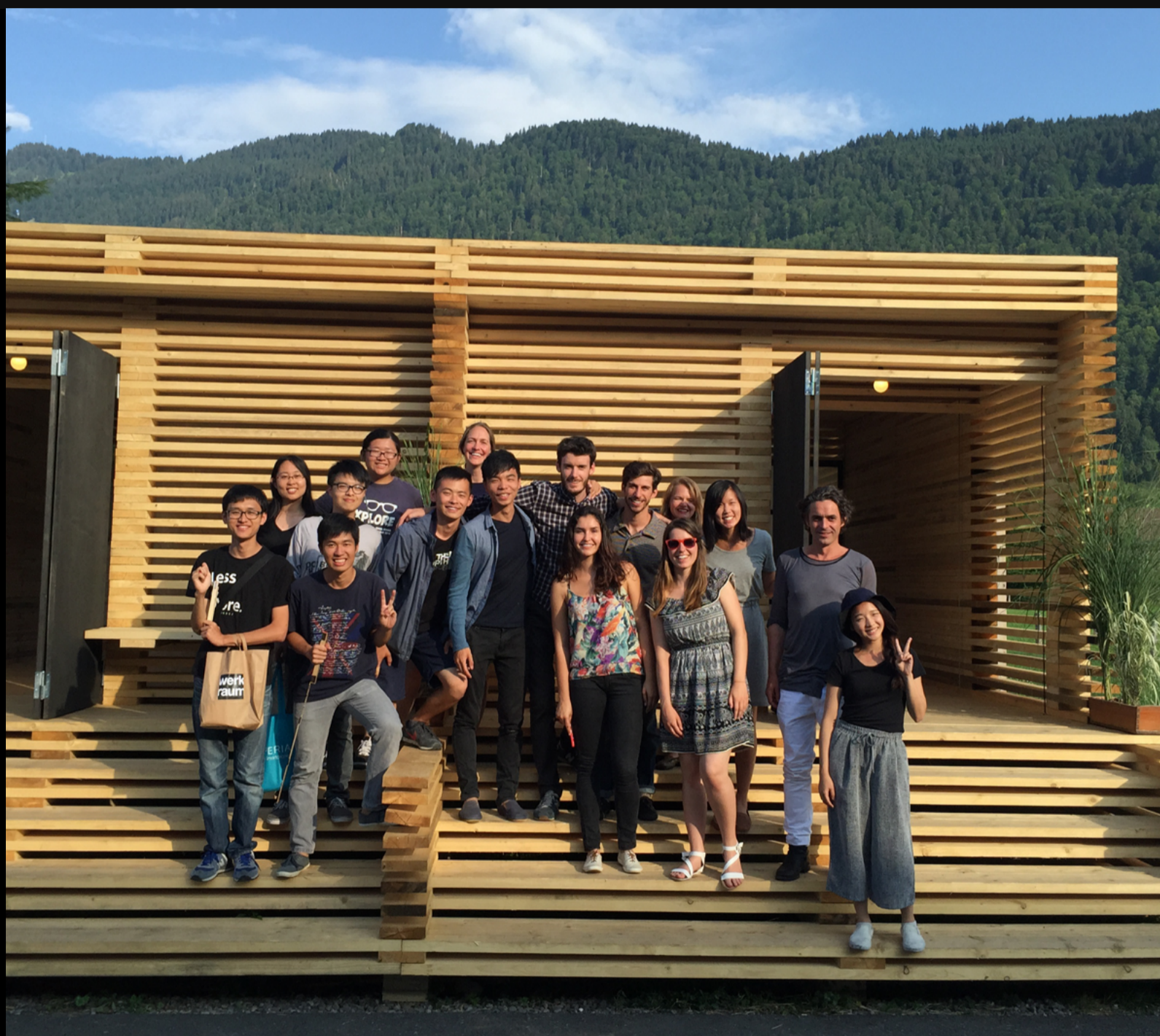
Figura 7. Grupo de trabajo.