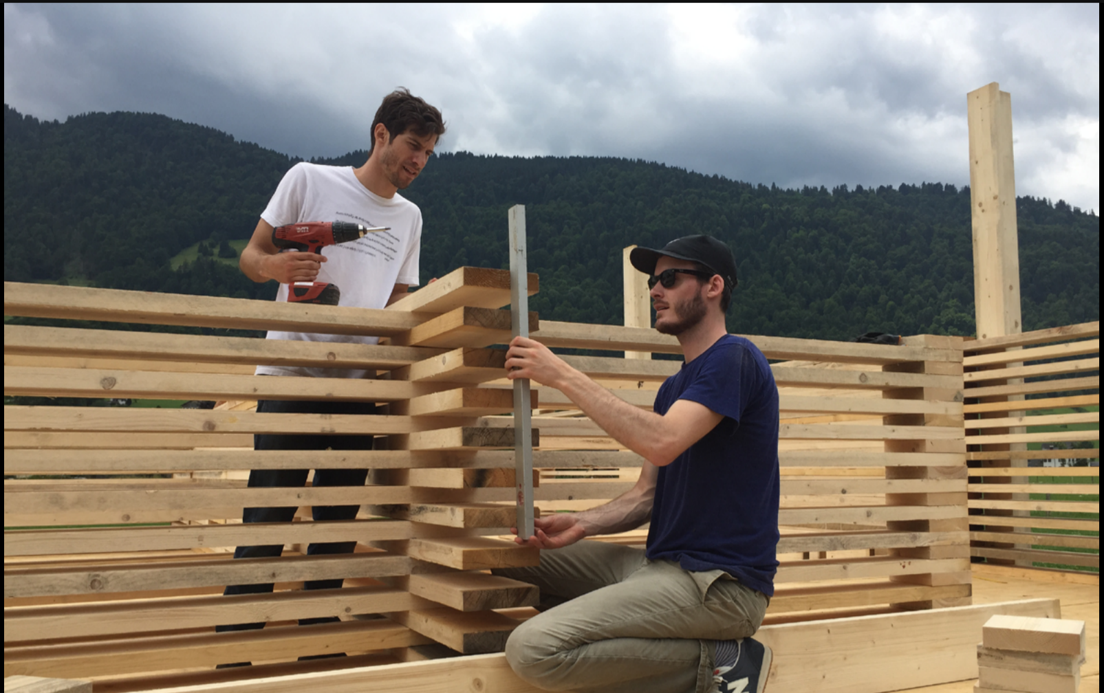
Figura 3. Estudiantes trabajando en madera.