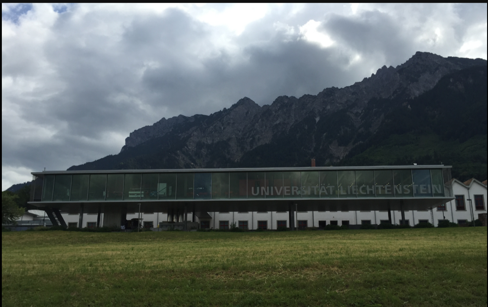
Figura 2. Universidad de Liechtenstein