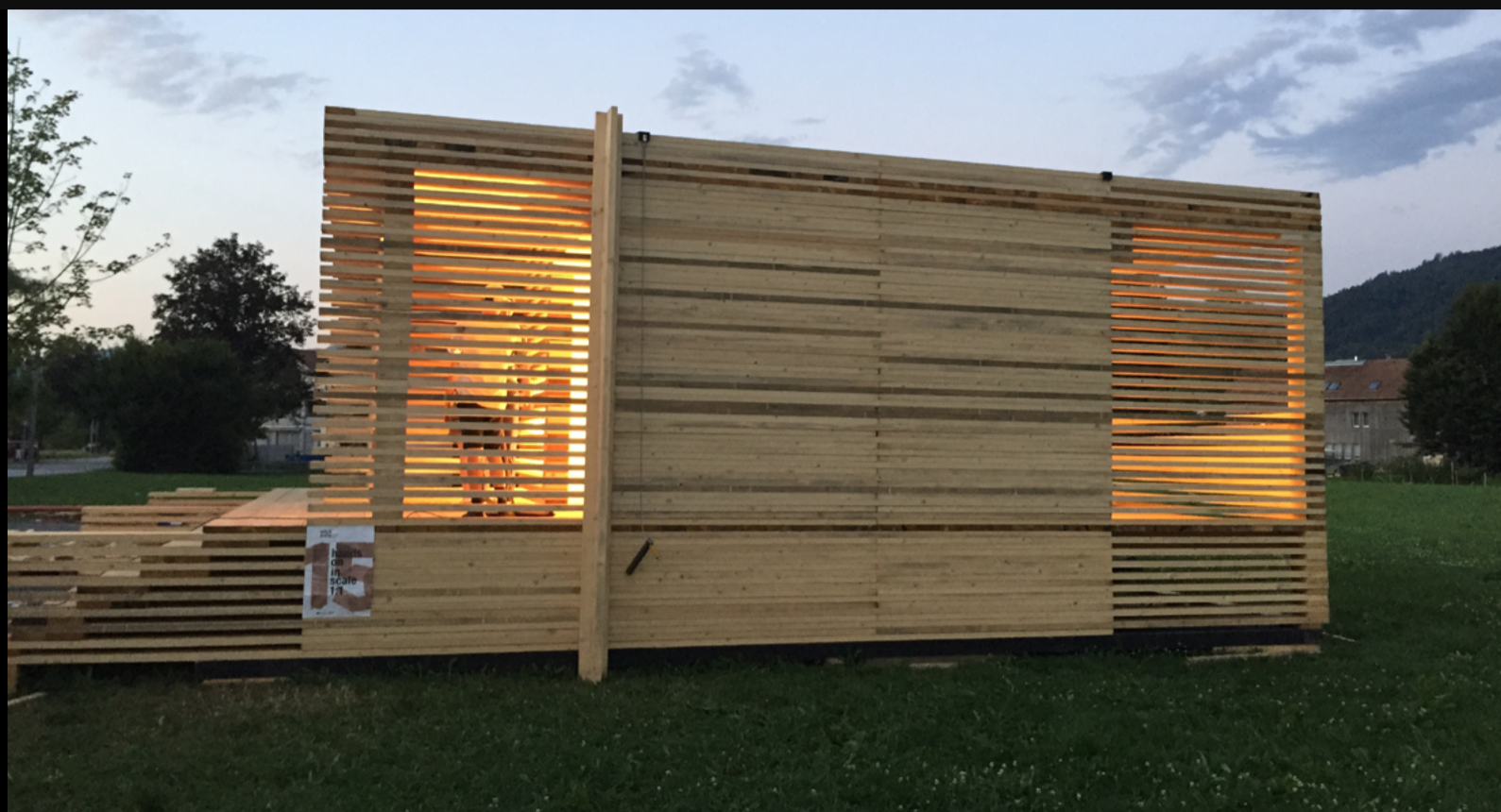
Figura 5. Vistas lateral. Fotografía: Sofía Hoch, 2015.