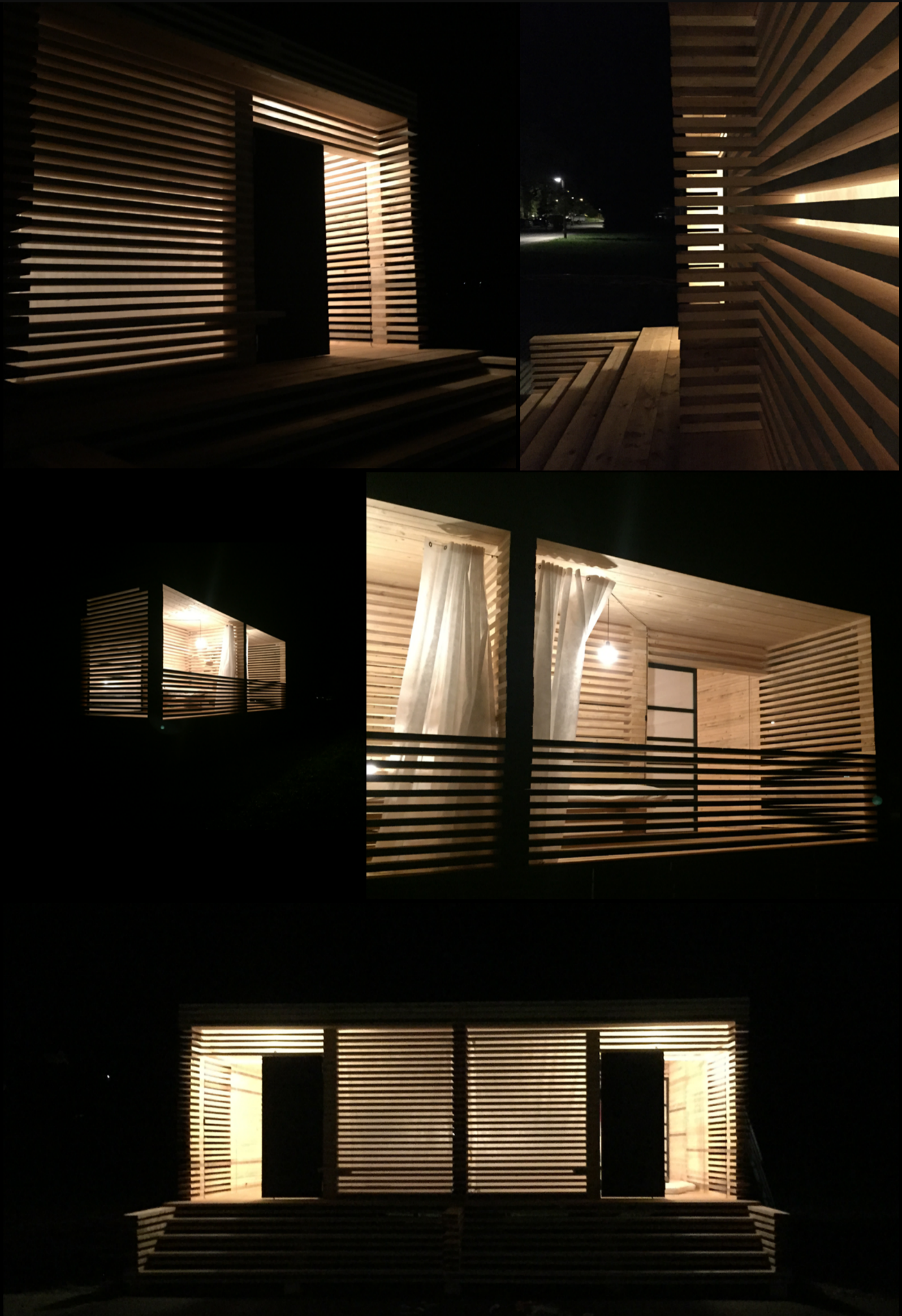
Figura 5. Visualización nocturna. Fotografía: Sofía Hoch, 2015.