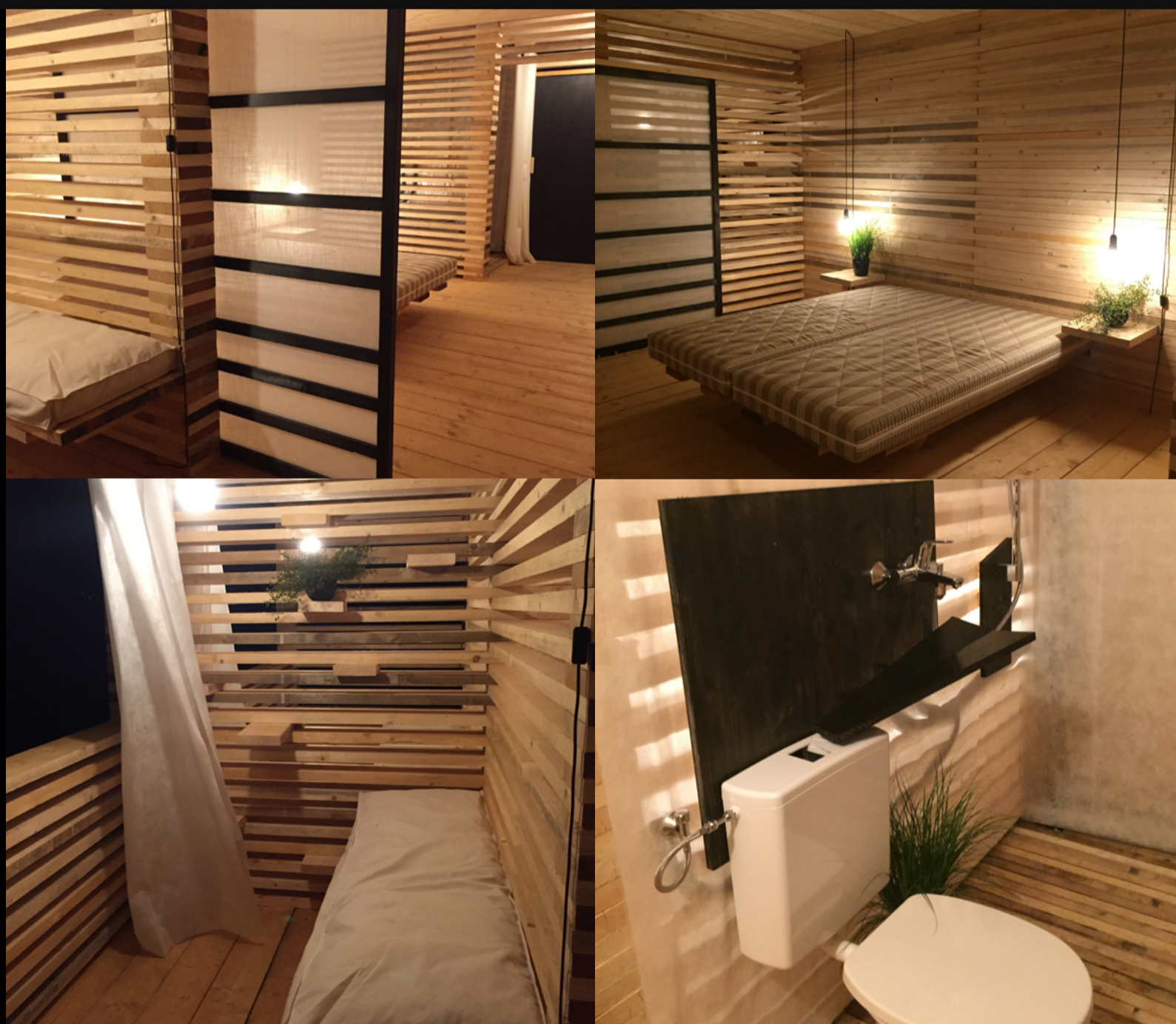
Figura 6. Vistas internas. Fotografía: Sofía Hoch, 2015.