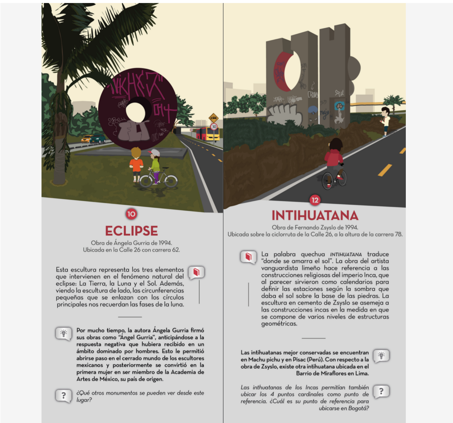
Figura 2. Monumentos "Eclipse" e "Intihuatana" como aparecen en la Guía