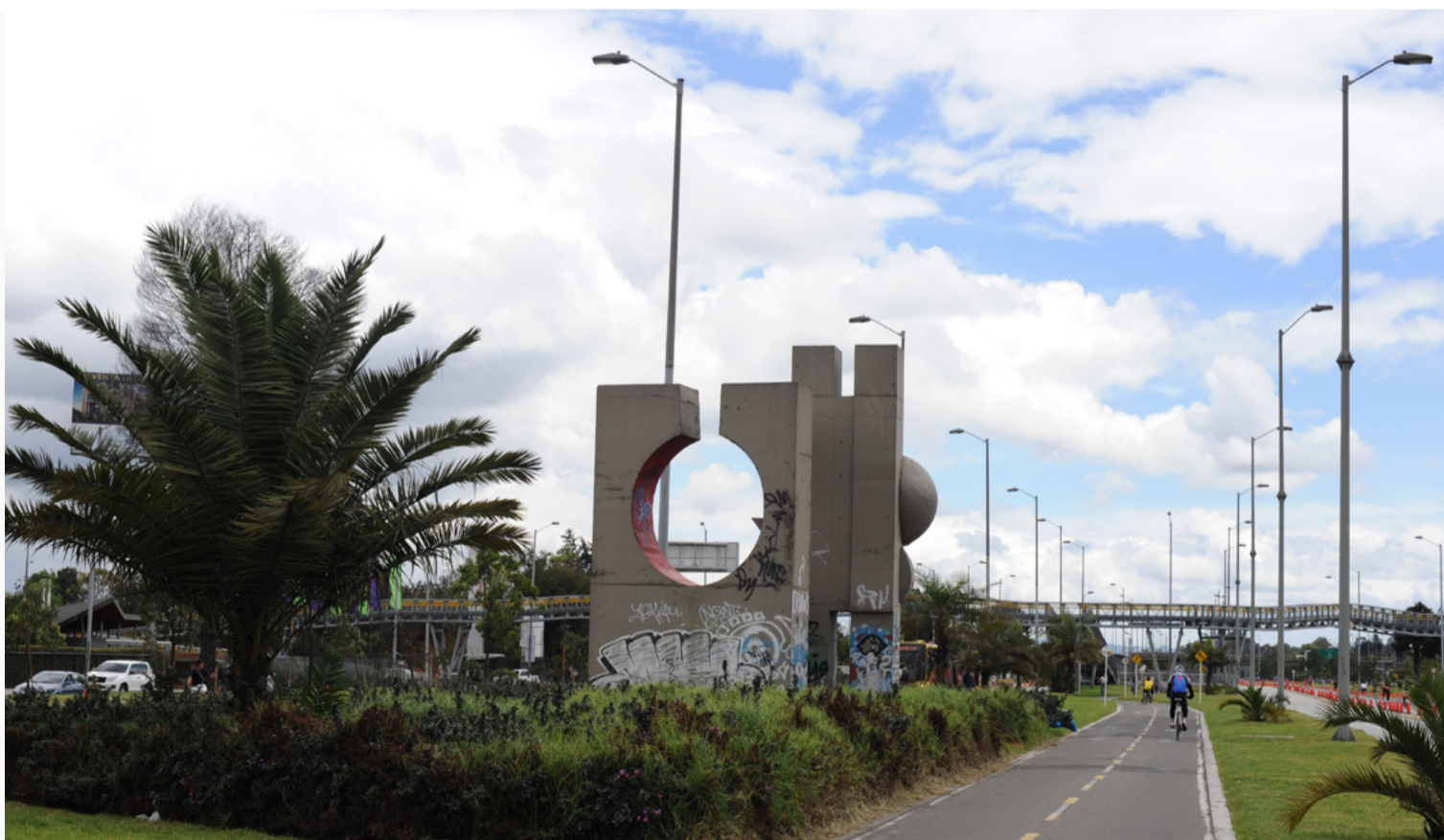
Figura 7. Ciclorruta de la Avenida del Dorado