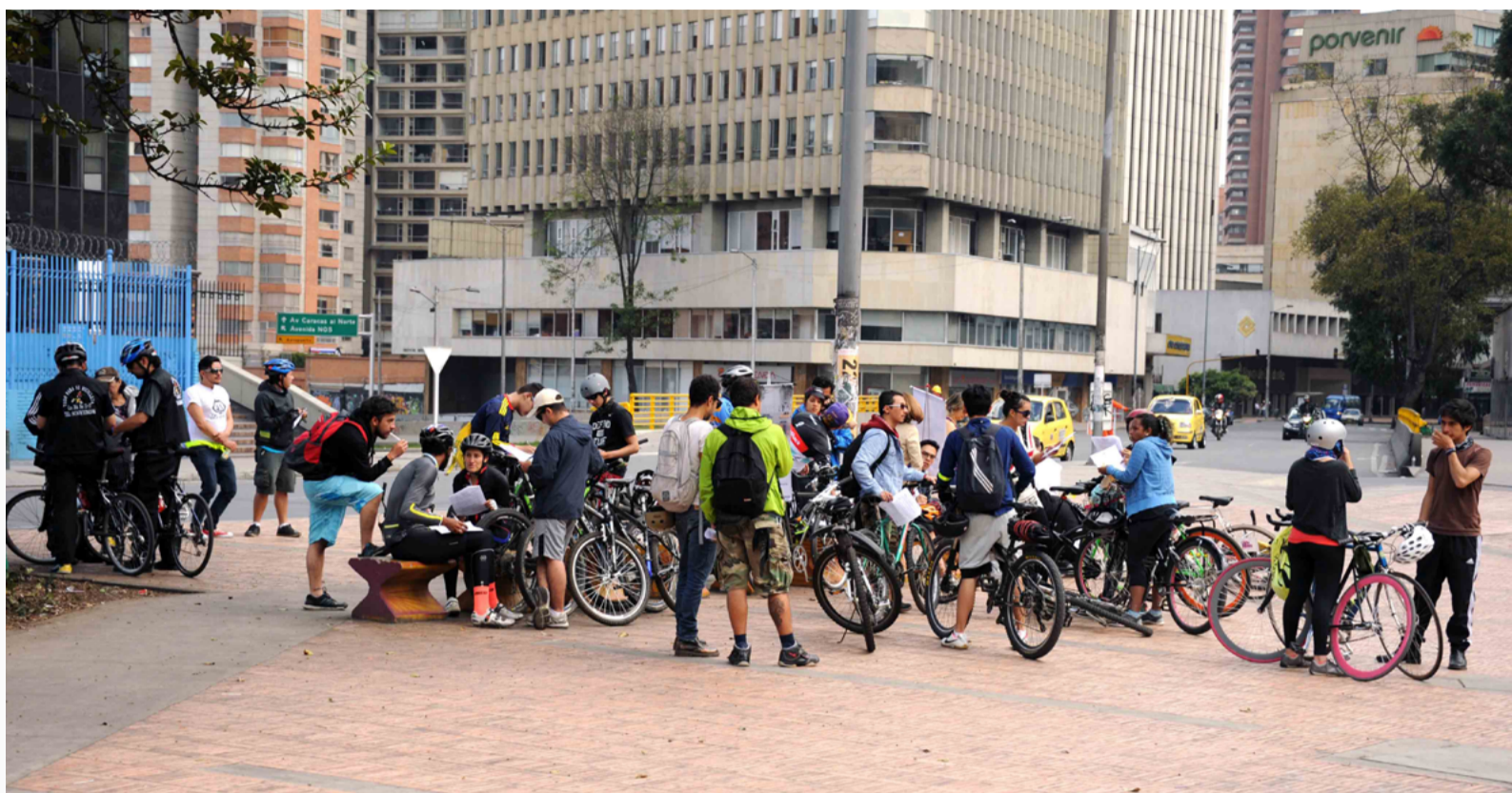
Figura 4. Carrera de observación