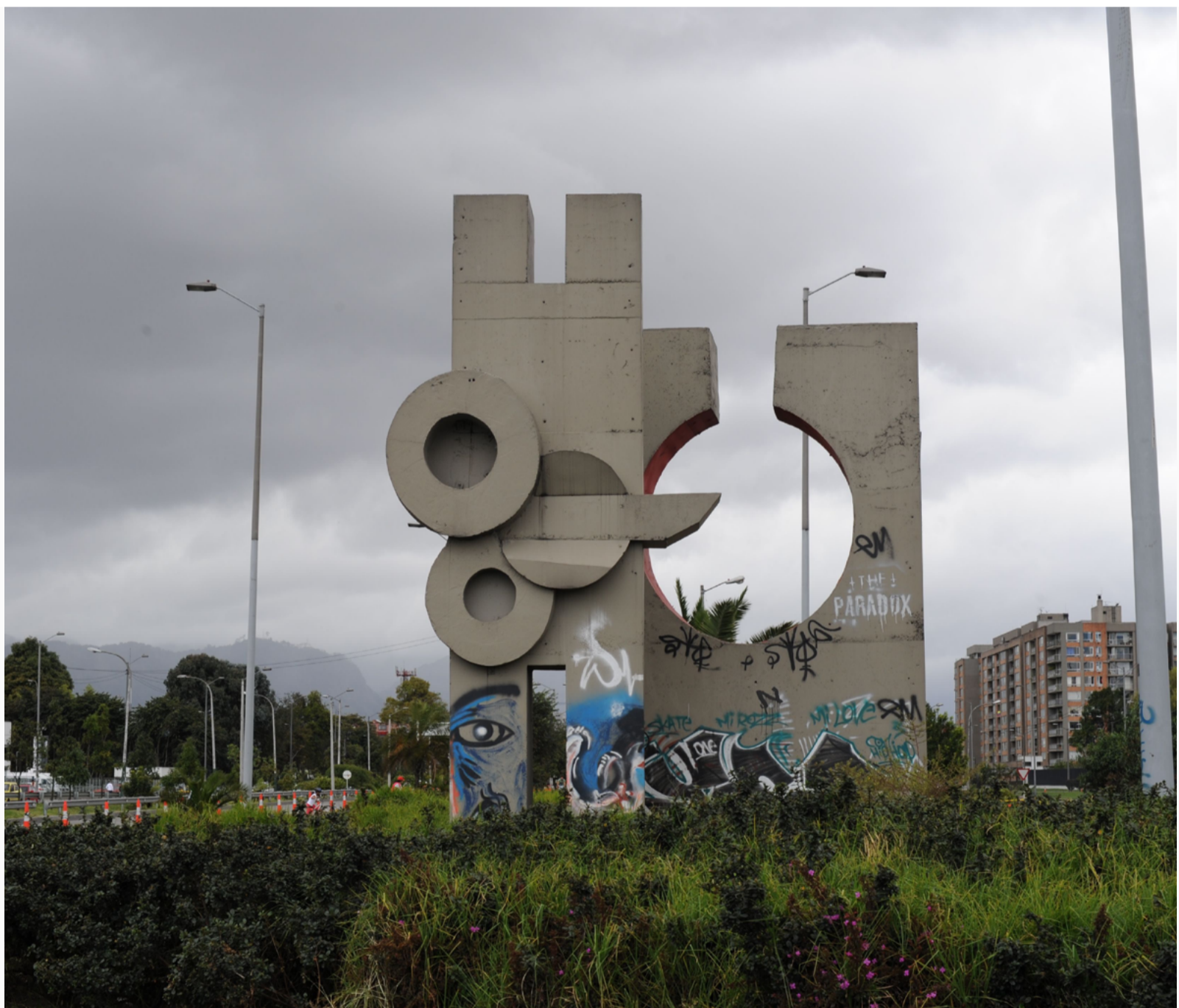
Figura 1. Monumento “Intihuatana” sobre la Avenida el Dorado

A partir de este momento, la guía 4 se dispuso para su descarga de manera gratuita en el sitio de Facebook del proyecto y por ese medio se continuó promoviendo el conocimiento del patrimonio de Bogotá. Todos los jueves se envían publicaciones donde se presenta un monumento, su historia, algún dato curioso y una pregunta para la reflexión de los usuarios. Sumado a la actividad en redes sociales se han hecho eventos de promoción, como la repartición de reflectivos y stickers alusivos al proyecto a los ciclistas que utilizan cotidianamente la ciclo-ruta de la Avenida El Dorado. El proyecto, a futuro, busca apoyo para poder imprimir y distribuir la guía también de manera gratuita y para trabajar en el diseño de guías “MUSEO A TODO PEDAL” para otras vías emblemáticas de la ciudad de Bogotá.