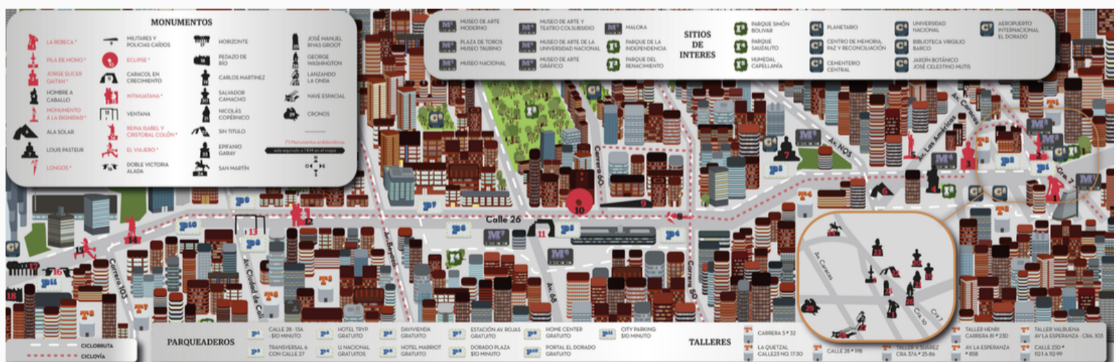
Figura 3. Mapa de los monumentos incluidos en la Guía