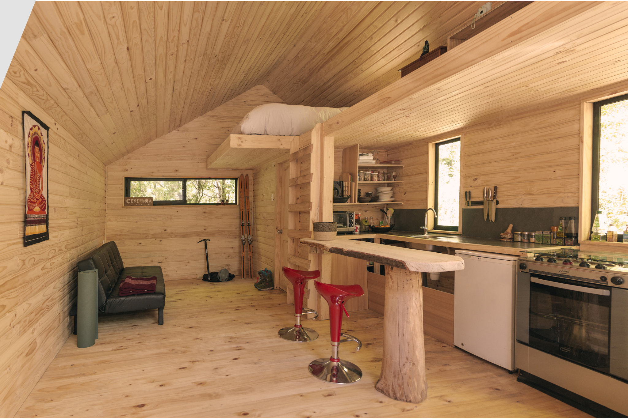
Figura 2. Refugio Pavón ▲