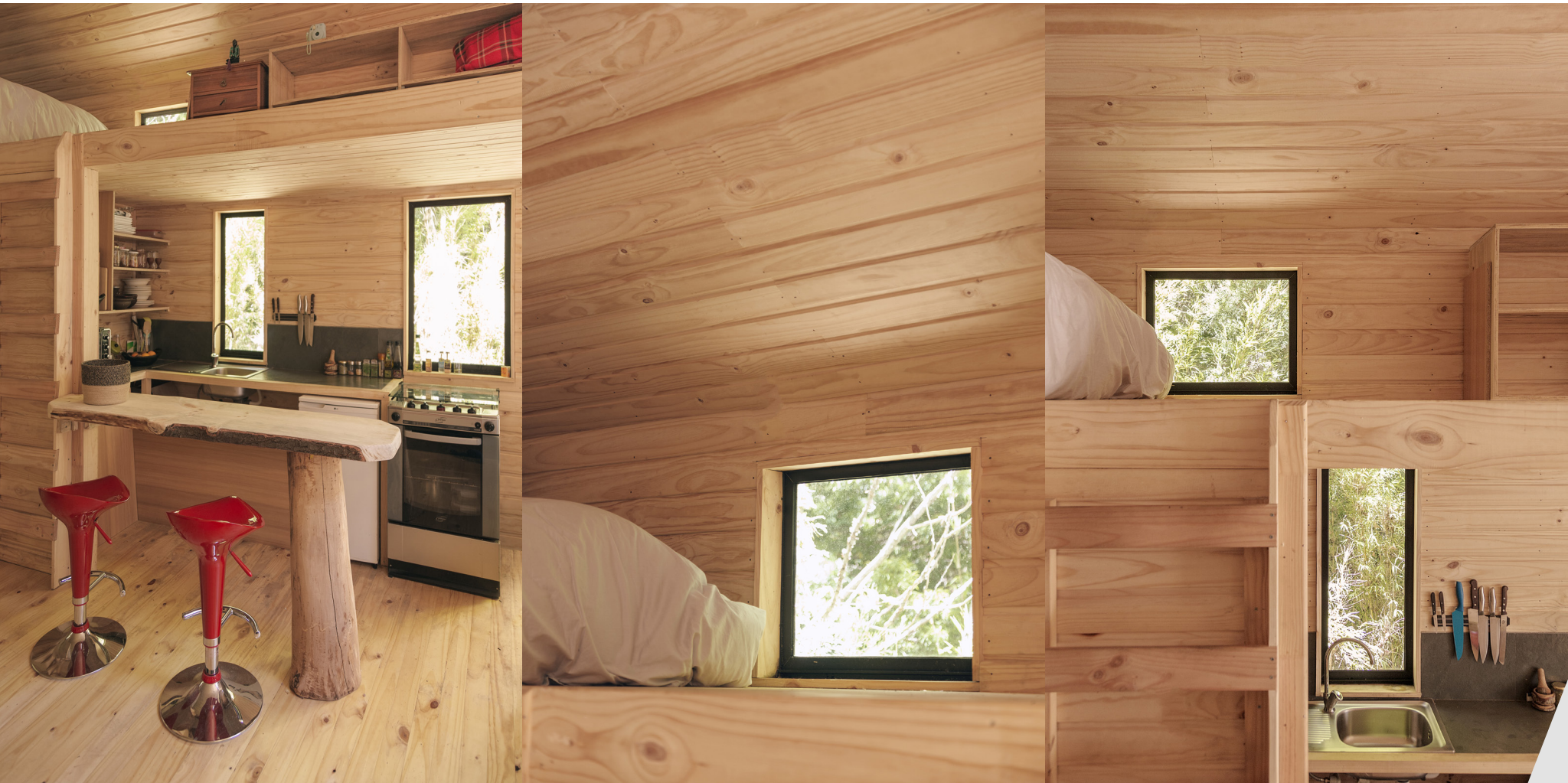
Figura 3-5. Refugio Pavón ▲