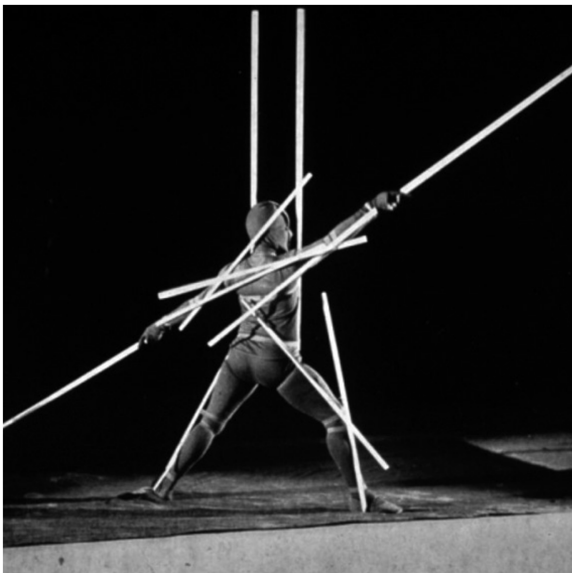
Figura 1. "Slat Dancer" Oskar Schlemmer.