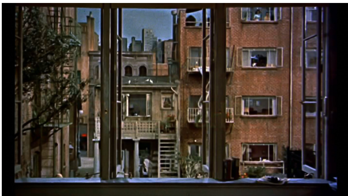
Figura 1. La vista de Jeff.

El inicio empieza exactamente recordando al espectador que se encuentra posicionado ante una situación de ficción, con el movimiento de las cortinas que se abren para que acceda a la ventana que hará las veces de pantalla (Figura 1). La visión que obtiene Jeff es en cierto modo análoga a la de Ramón (Àlex Casanovas), el protagonista de Kika (1993) de Pedro Almodóvar, en virtud de que el estilo de la construcción de inmuebles resulta muy similar: grandes, altos e impersonales bloques de pisos –que dan la impresión de enjaular a sus habitantes–, a pesar de que correspondan a países de dos continentes distintos: un suburbio neoyorkino y una gran ciudad en Madrid (Figura 2). A diferencia en ambos casos de la novela de Vélez de Guevara, la visión no emana desde arriba, como en cenital (salvo el momento inicial en que, desde la perspectiva aérea de unos pícaros sujetos en helicóptero, la cámara se acerca para mirar a unas jóvenes tomando sol en los tejados). Rear Window procede de otra forma menos excéntrica y más propicia a la identificación del espectador, semejante a la del protagonista de Kika (1993): como una toma (casi siempre subjetiva) a nivel, posicionándose como un personaje (Jeff) que mira desde la ventana en una distancia que impide visualizar detalles pero que se solventa con equipo adecuado como prismáticos y lentes de acercamiento.