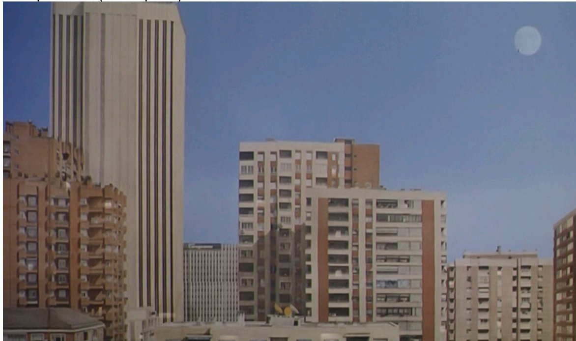
Figura 2. La vista de Ramón.

nos permite asomarnos a otras o incluso vivirlas vicariamente, o atisbar las nuestras posibles que descartamos o que quedaron fuera de nuestro alcance o no nos atrevimos a emprender” (2008, p. 36).