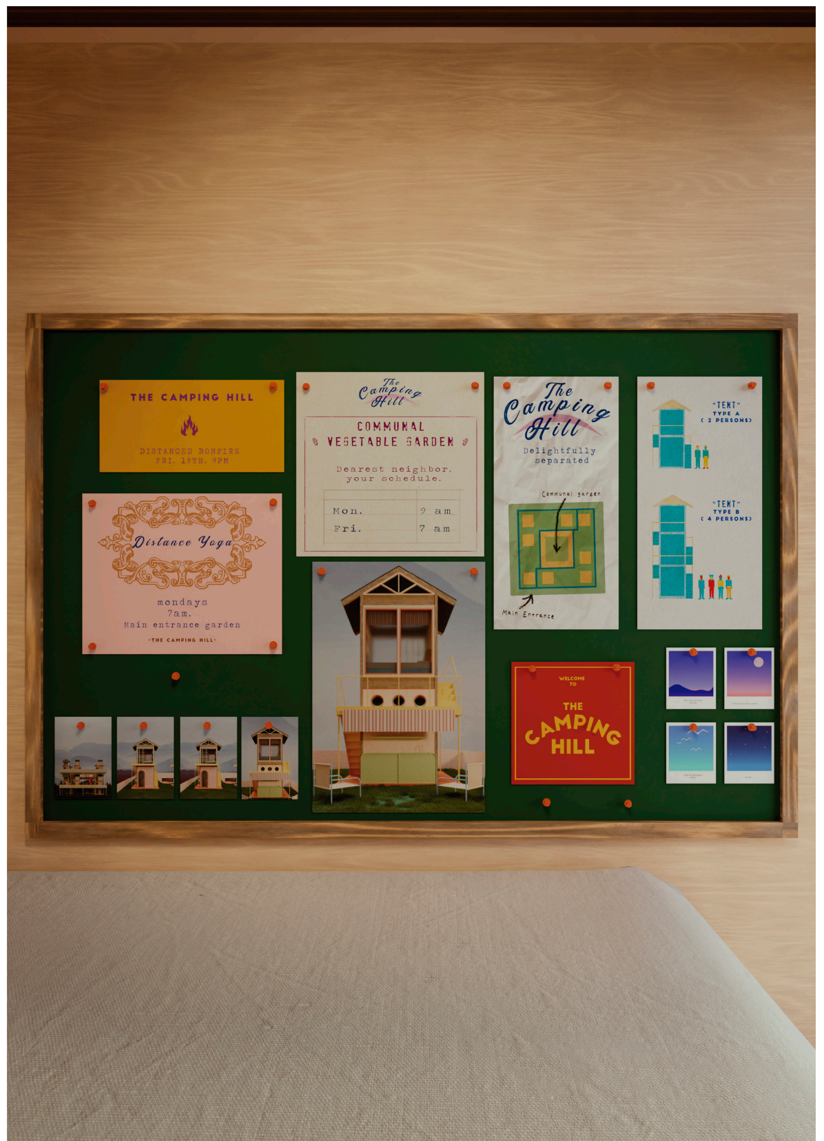
Fig. 3. “Concept Image”. ➤

En medio de las pequeñas carpas, los jardines y los múltiples colores, los cuarenta campistas construyen una nueva forma de ser vecinos y vecinas, encantadoramente separados. (Fonseca y Picado, 2020)