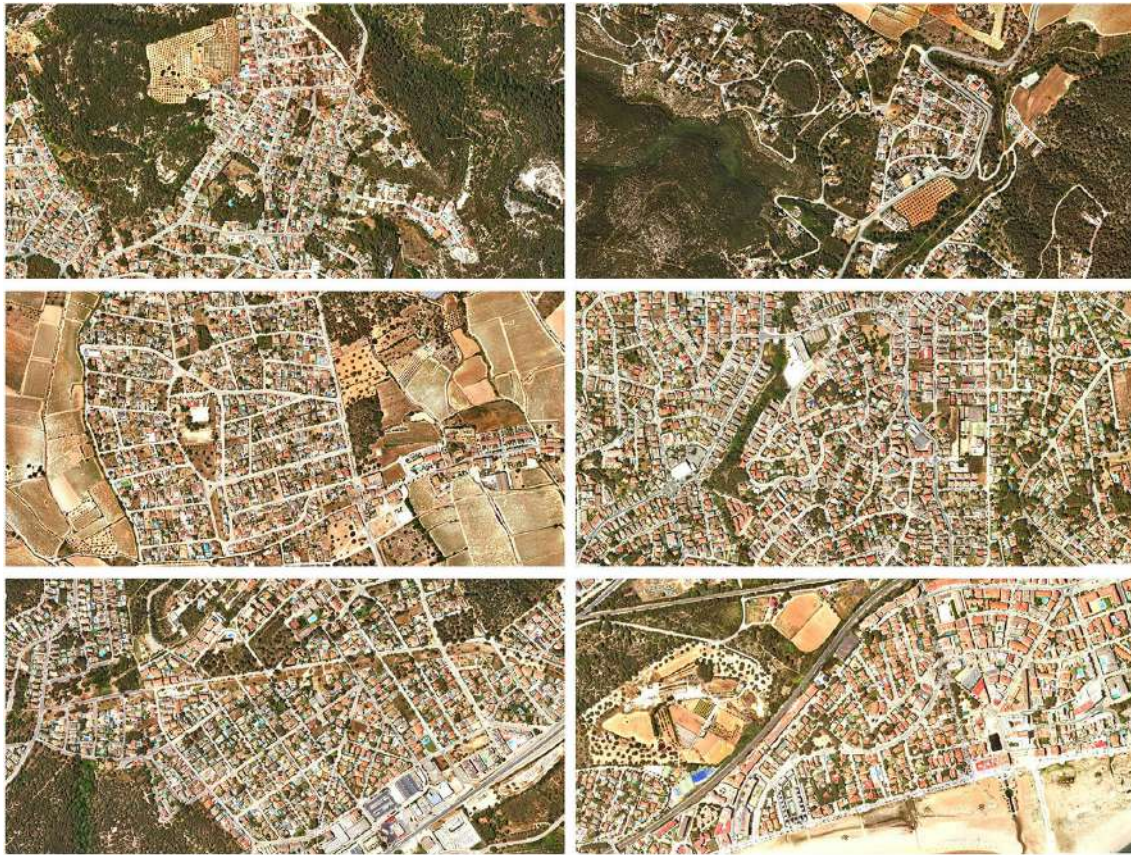
Figura 4. Ortofotografías del Institut Cartogràfic y Geològic de Catalunya, 1:25000 sobre base ETRS89, 2021