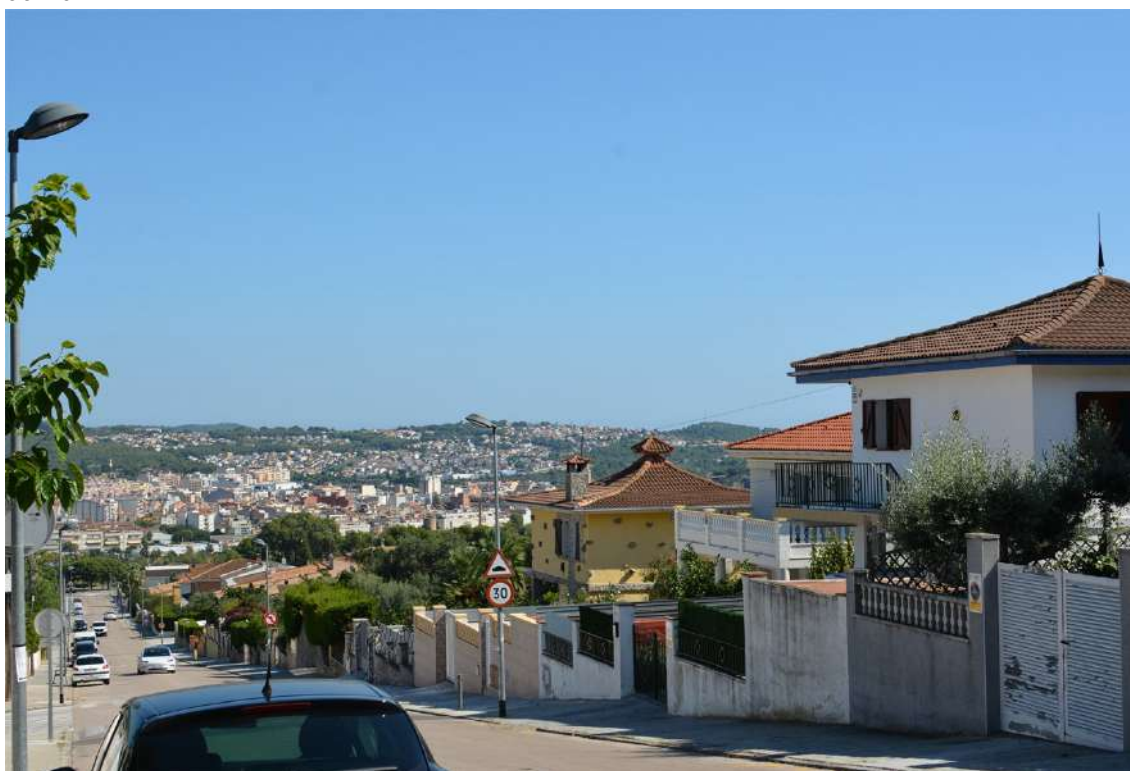
Figura 5. Urbanización del Nou Vendrell, T.M. El Vendrell. Al fondo, las urbanizaciones El Oasis y Baronia de Mar