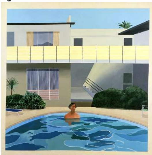
Figura 2. Portrait of Nick Wilder