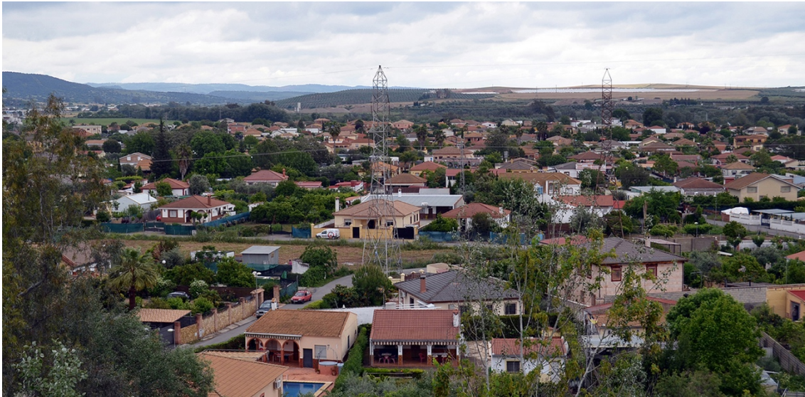
Figura 2. Vista general de una Urbanización ilegal en la zona de la vega del municipio de Córdoba (España)

hará que el suministro de dichas infraestructuras sea complejo, costoso y, en no pocas ocasiones, técnica o económicamente inviable. Ello, junto a la progresiva conversión de muchos de estos ámbitos en zonas de vivienda habitual, los irá convirtiendo en barriadas periféricas con una cierta tendencia a la marginalidad urbana (López-Casado, 2021a).