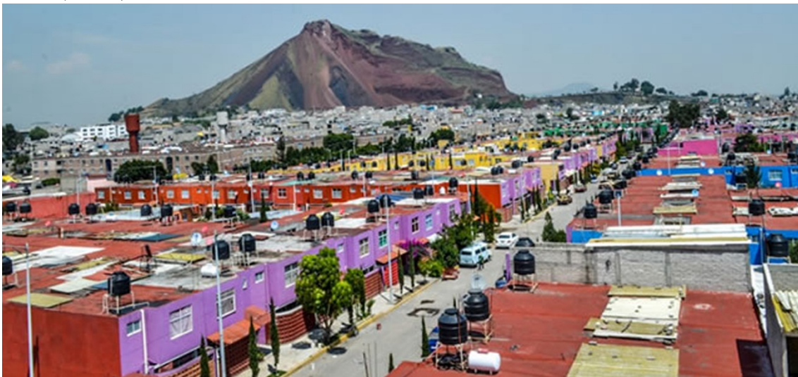
Figura 1. Asentamiento desarrollado a partir del modelo de Producción Social de Hábitat Ciudad de México (México)