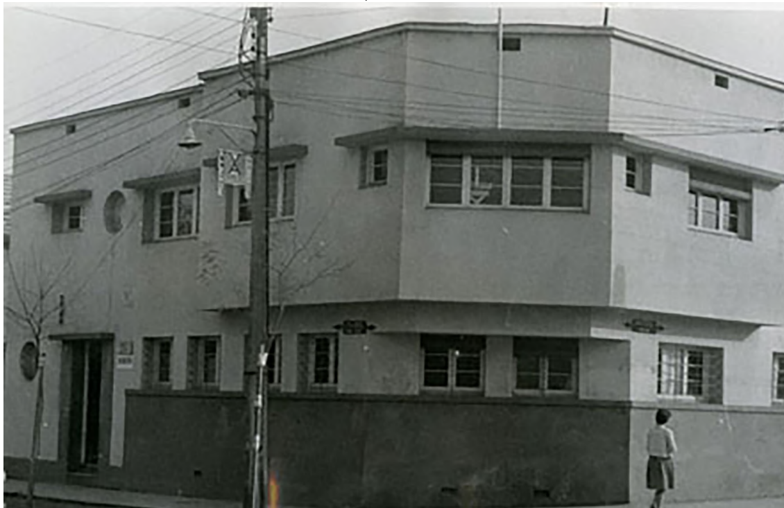
Figura 8. Vista actual del ex Consultorio n°6. Esquina Manuel de Amat y San Alfonso

Se trata de una edificación de escala local, probablemente destinado, como otros de similares características, a las atenciones de medicina general, fisiología, pediatría, toxicología, dental, venereología, o bien a las enfermedades del propias del trabajo, atendiendo a las necesidades inmediatas de la población y a los controles planificados.