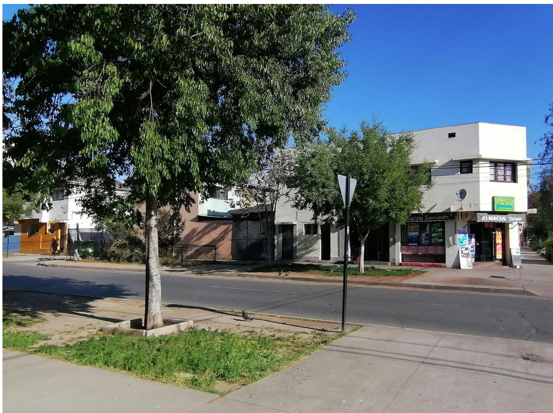
Figura 5. Vista del pasaje Oriente desde la manzana n°3 hacia la manzana n°8. Se aprecian las edificaciones en bloque y al fondo las viviendas de dos pisos de la Población Central de Leche, por calle Gaspar de la Barrera

En la manzana n° 3 se ubica un grupo residencial conformado por tres bloques de vivienda de departamentos, con tres pisos de altura, que se despliegan longitudinalmente en sentido oriente-poniente, generando espacios intermedios para su acceso y disfrute de áreas verdes (Figura 5).