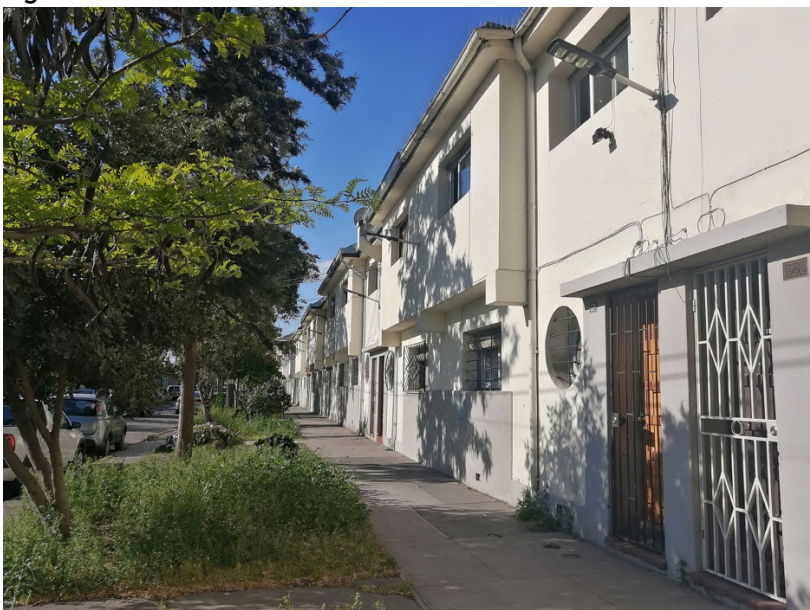
Figura 3. Vista de las viviendas de la manzana n°8 de la Población Central de Leche, por calle Conferencia

Las viviendas presentan una expresión de fachadas simple, con cierto valor formal dado por su volumetría y por el cambio en el paramento vertical de uno de los recintos del segundo piso que se invierte sucesivamente en cada unidad (Figura 3). Los vanos de forma ortogonal alternan con ventanas circulares características de la arquitectura racionalista de la época.