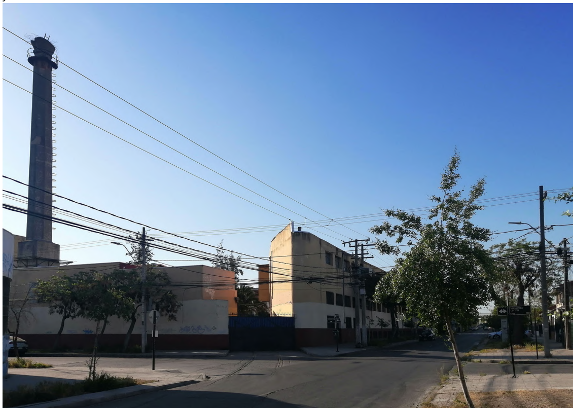
Figura 10. Vista de la Fábrica Central de Leche, desde el acceso de carga, se aprecia la huella de los rieles y el volumen oriente