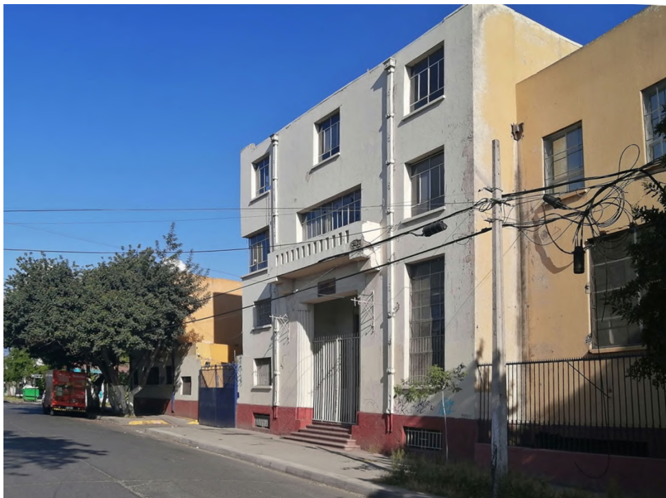
Figura 9. Vista de la Fábrica Central de Leche, volumen administrativo y acceso principal por calle Manuel de Amat