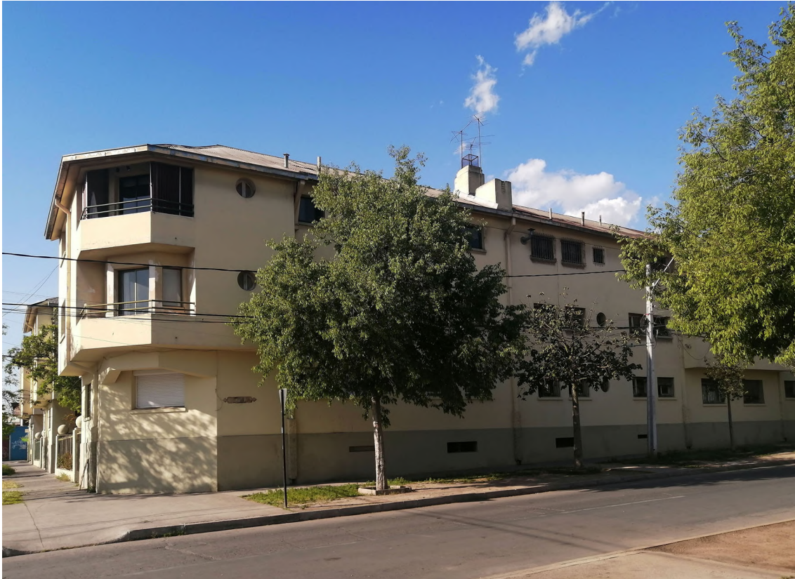
Figura 6. Vista de uno de los bloques residenciales por calle Gaspar de la Barrera Se observa la resolución de la esquina en ochavos y balcones