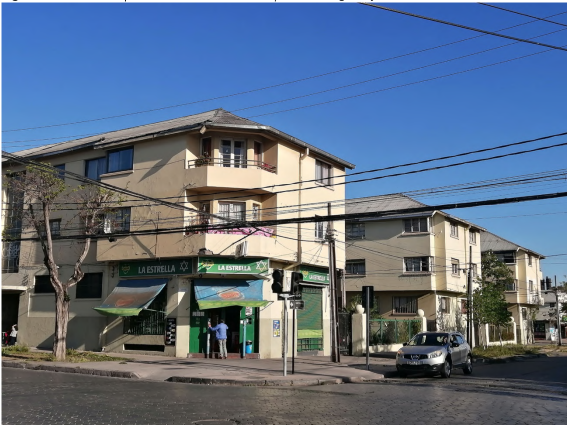
Figura 7. Vista los bloques residenciales desde esquina Antofagasta y Conferencia