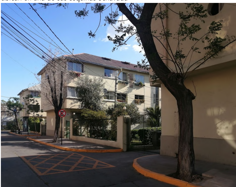
Figura 4. Vista de las viviendas de la Población Central de Leche y los actuales locales comerciales que se ubican en una de sus esquinas ochavada