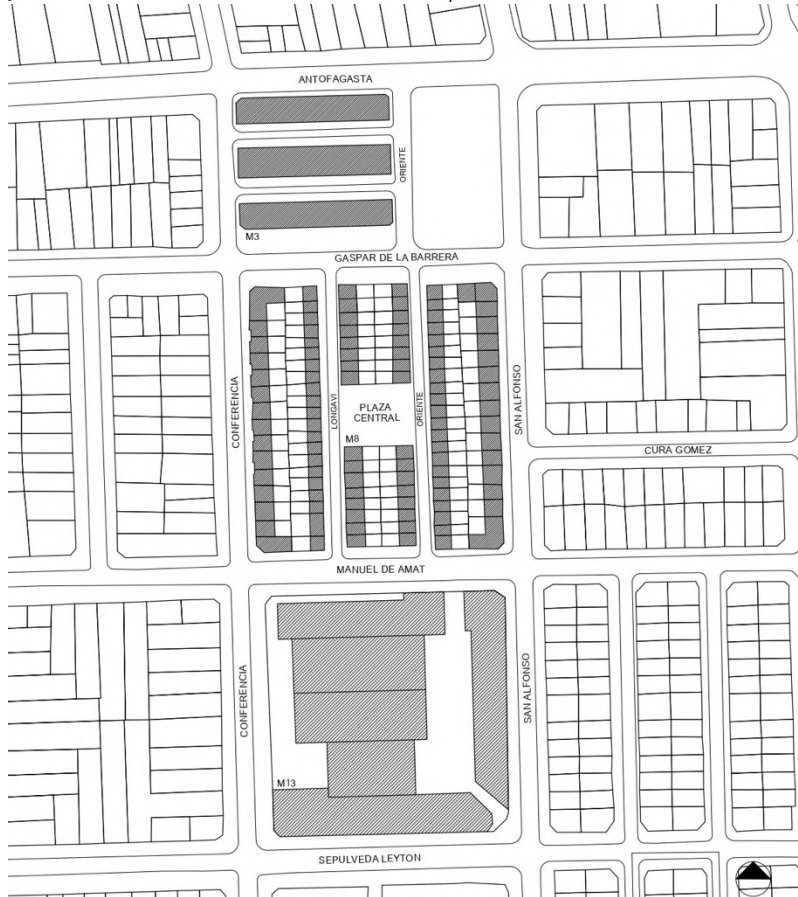
Figura 2. Plano que ilustra la conformación de la manzana 8 (M8) de la Población San Eugenio en la que se construyeron las viviendas de la Población Central de Leche, ubicada entre las calles Gaspar de la Barrera, Manuel de Amat, Conferencia y San Alfonso. Al sur la manzana n°13 (M13) en la que se edificó de la fábrica Central de Leche y al norte la manzana n°3 (M3) en la que se edificó el grupo de edificios colectivos pertenecientes a la misma Población Central de Leche. En la esquina nor oriente de San Alfonso y Manuel de Amat se ubica el inmueble que funcionó como consultorio n°6