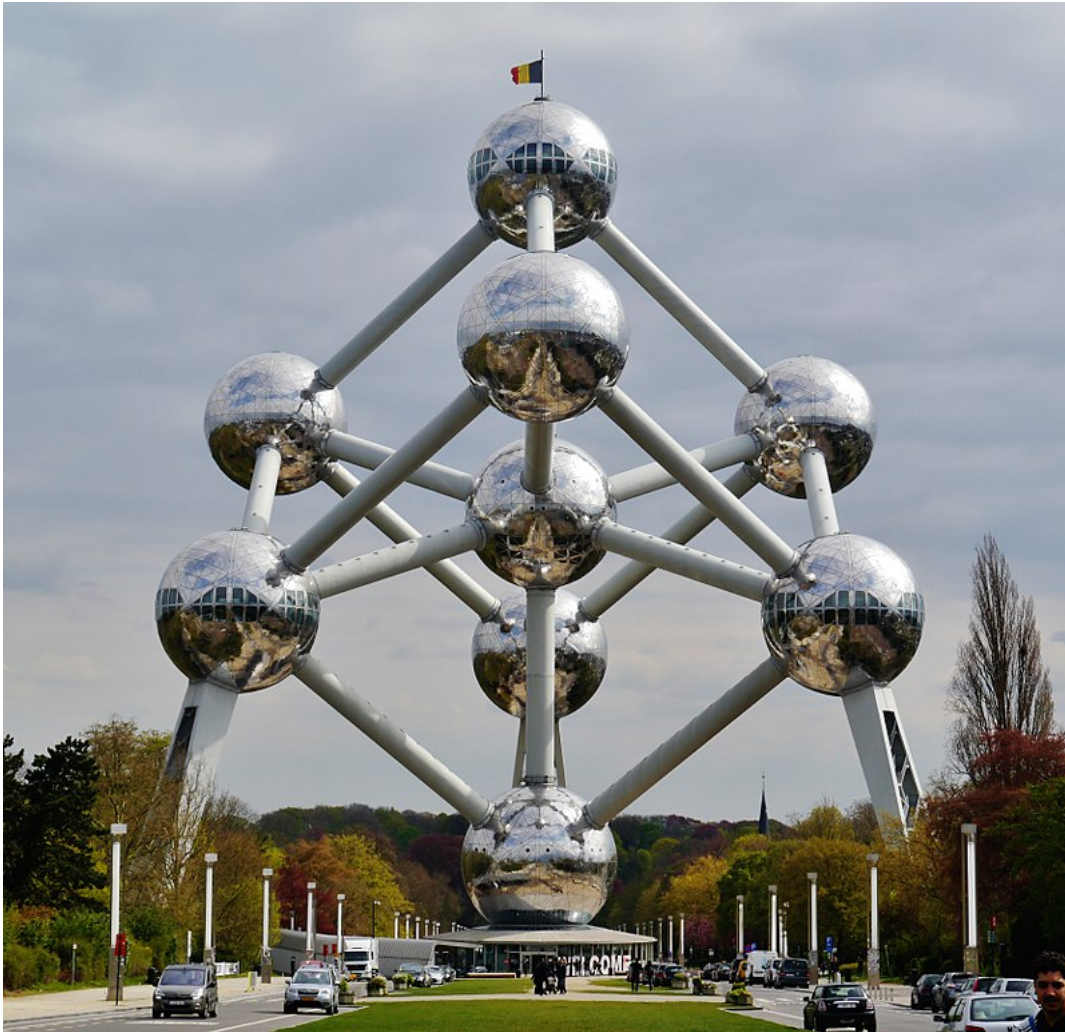
Figura 3. El Atomium, Bruselas, Bélgica, 1958

Nota: Laeken Atomium [Fotografía], 2016.