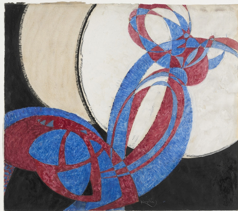
Figura 1. Fotografía del Cuadro "Fuga de dos Colores"

Nota: Réplica de la fuga en dos colores Amorfa [Fotografía], por Frantisek Kupka, 1912.