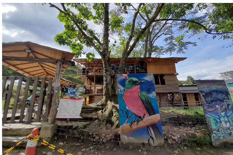
Figura 2. Entrada al Ecoparque La Escombrera

Pero lo que se descubre poco a poco es todo lo contrario. La destrucción de los seres no significa que se hayan ido a otra parte. Están allí, están realmente allí: allí, en las flores de los campos; allí, en la savia de los abedules; allí, en ese pequeño lago donde descansan las cenizas de miles de cuerpos. (p. 63)