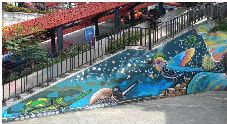
Figura 3. Mural Operación Orión colibríes y escarabajos

Ese modo de estar parece cambiar la forma de relacionarse con el mundo. Los techos de la Comuna, antes tenues, son ahora pintados de colores. Pareciera que ese habitar requiere luz para opacar las figuras del dolor que les acechan, en el encuentro con esa esquina que guarda un hecho específico, vuelto estetograma, pero que al mismo tiempo requiere color y una marca que señale la diferencia frente a las marcas militares que pasaron.