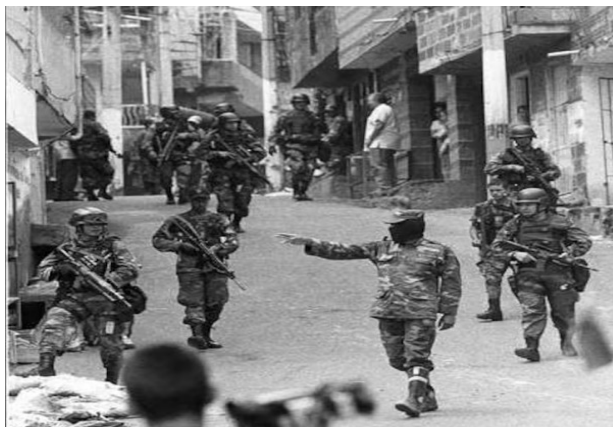
Figura 1. La Escombrera

Orión se levantó en una ola de humo y gas; iba caminando con un dedo en alto, con el cual señalaba el rumbo hacia donde debía dirigirse. La imagen captada por el fotógrafo Jesús Abad Colorado (2002) 4 en la que se observa un hombre con capucha, sin insignias militares correspondientes al Ejército Nacional, señalando y dando órdenes al propio ejército, ha sido una de las imágenes más contundentes de dicha Operación (ver Figura 1 ).