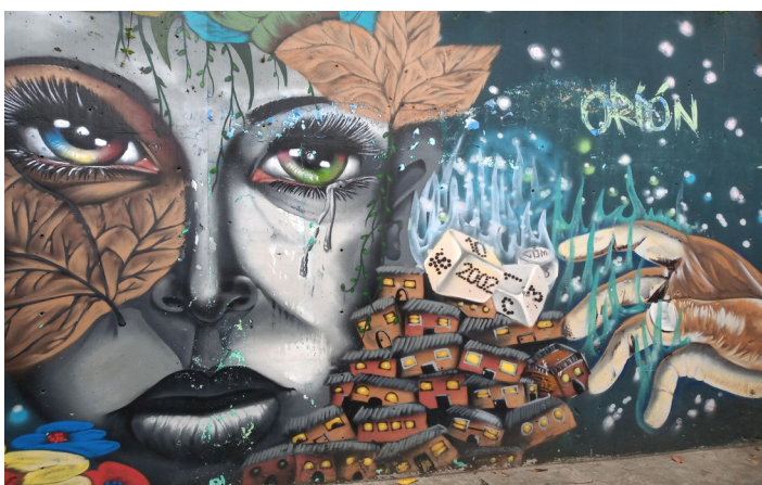
Figura 4. Mural Operación Orión lágrimas de la Comuna 13

Los símbolos compartidos, como el helicóptero que sobrevolaba la Comuna, forman parte de la memoria colectiva que busca ser transmitida a visitantes y turistas. Uno de los grafitis ubicados en las escaleras eléctricas recrea la Operación Orión, sin duda la que más huella ha dejado en sus habitantes. En él, los helicópteros están representados en colibríes; las tanquetas, como escarabajos (ver Figura 3); los destellos y las lágrimas acompañan lo tenue de unas casitas diminutas que se esconden en un rincón (ver Figura 4). Las garras de este pájaro sobrevuelan las casas, desprovistas de corazas. Estos símbolos encontrados se convierten, quizás, en una manera amigable de contrastar lo sucedido a partir de un ejercicio político gestado en la Comuna.