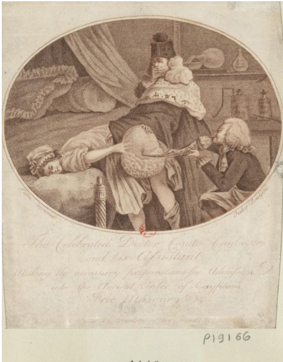
Imagen 1 Grabado satírico del conde Cagliostro 1784

El grabado tiene la leyenda: "The Celebrated doctor comte Cagliostro and his assistant: making the necessary preparations for admission into the ancient Order of Egyptian free masonry" (London, 1784).