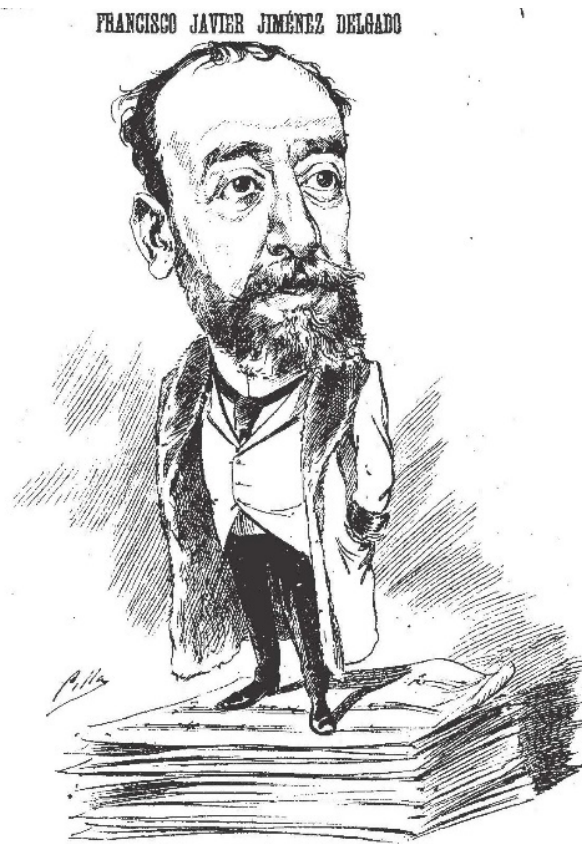
Figura 4. Portada de Madrid Cómico del 07-11-1891 100