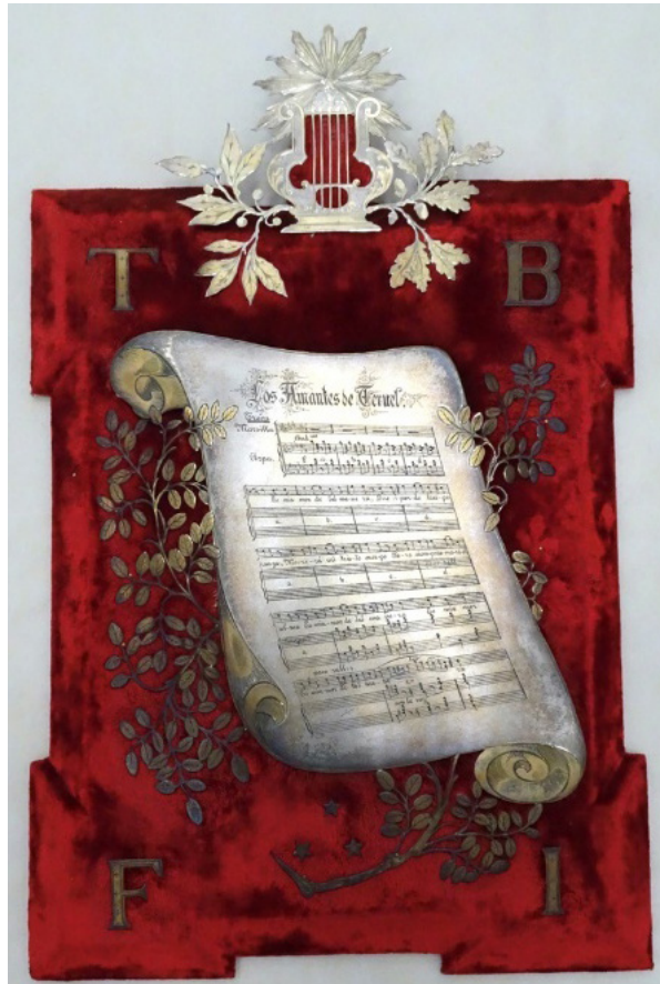
Figura 3. Placa conmemorativa del maestro Tomás Bretón de abril de 1890 76