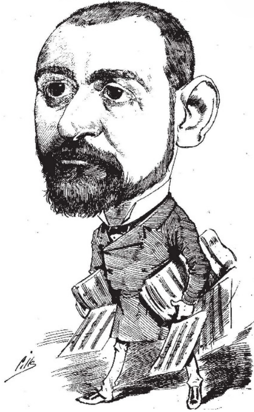
Figura 5. Portada de Madrid Cómico del 23-01-1886 158

Fuente: Imagen procedente de los fondos de la Biblioteca Nacional de España