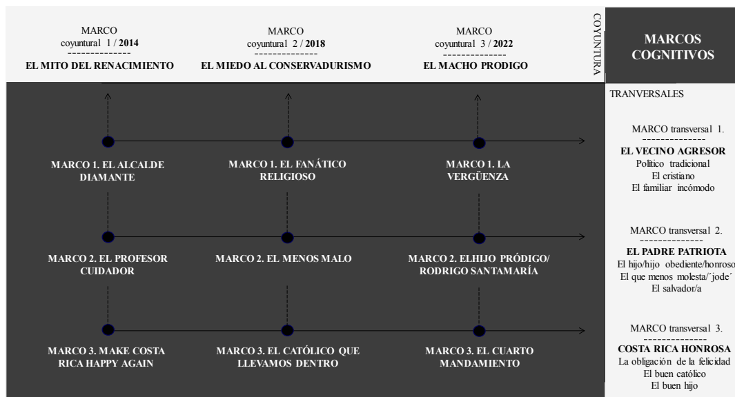
Figura 6. Conexión de los marcos coyunturales y transversales según los marcos identificados en cada período electoral, 2014, 2018, 2022

(que se presenta como no conservador, o menos conservador) y modernidad moderada en Costa Rica. Por último, el “macho prodigo”, que es la figura que vuelve a casa, y que después de haber logrado cierto reconocimiento internacional, vuelve como un decoroso hijo. Además, las consignas apelaban a la figura de un hombre fuerte, connotando la idea de un macho. Rodrigo Chaves era percibido por algunos sectores como un hombre en el sentido de ser directo y firme en su comportamiento, y por otro, encarnaba la figura de macho tradicional, caracterizado por actitudes agresivas e insolentes, con denuncias de acoso sexual. Para ver la conexión cronológica y que conecta lo coyuntural con lo transversal véase la figura 6.