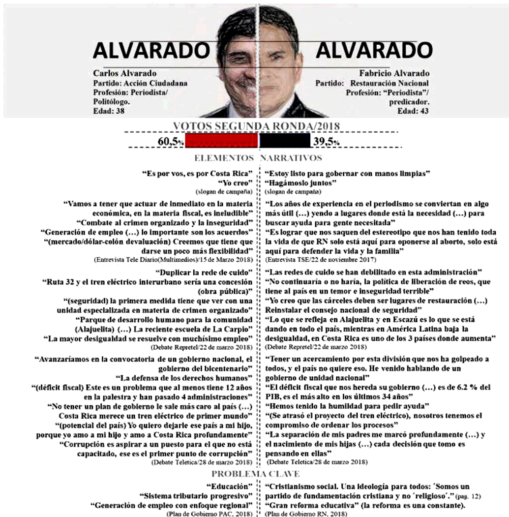
Figura 3. Perfil 2. Candidatos según partidos, elementos narrativos y problemas clave: Alvarado/ Alvarado, 2018