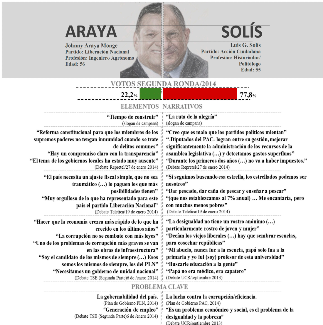
Figura 2. Perfil 1. Candidatos según partido, elementos narrativos y problemas clave: Araya/Solís, 2014