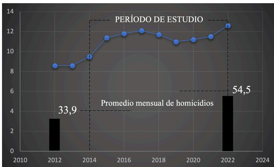
Figura 1. Tasa de homicidios y promedio de homicidios por mes, Costa Rica, 2012-2022