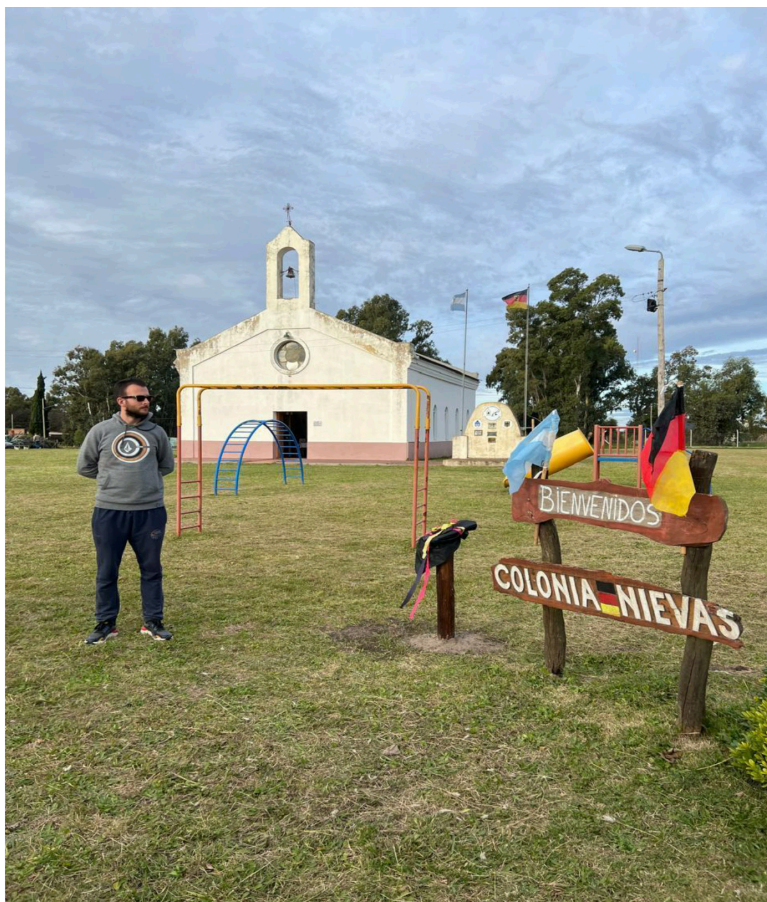
Fotografía 2. Inauguración del Sendero de Interpretación Identitario de Colonia Nuevas, Colonia Nuevas, mayo 2024