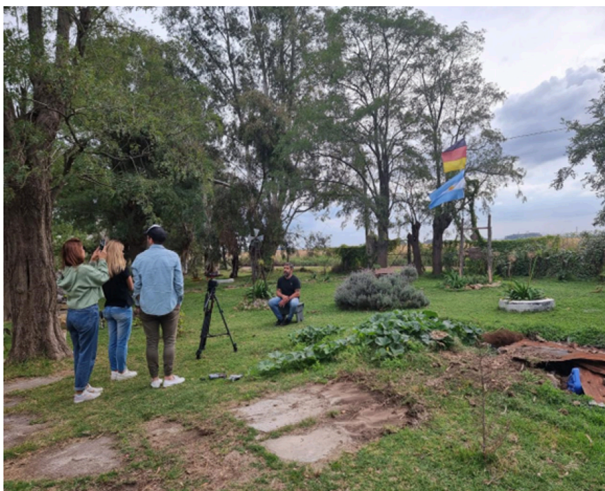
Fotografía 1. Escena de rodaje del documental, Colonia Nuevas, abril 2022

la Sociedad de Fomento Juventud Unida, el Intendente Municipal, el secretario de Desarrollo Humano y Calidad de Vida, así como diversos concejales de diferentes espacios políticos.