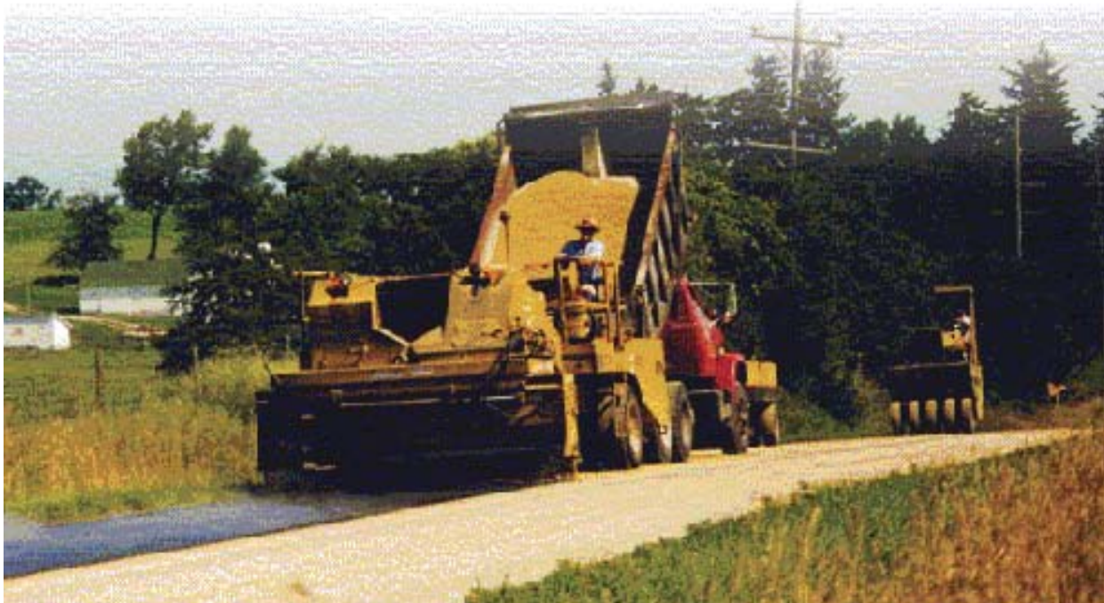
Fotografía 4. Distribuidor de agregados