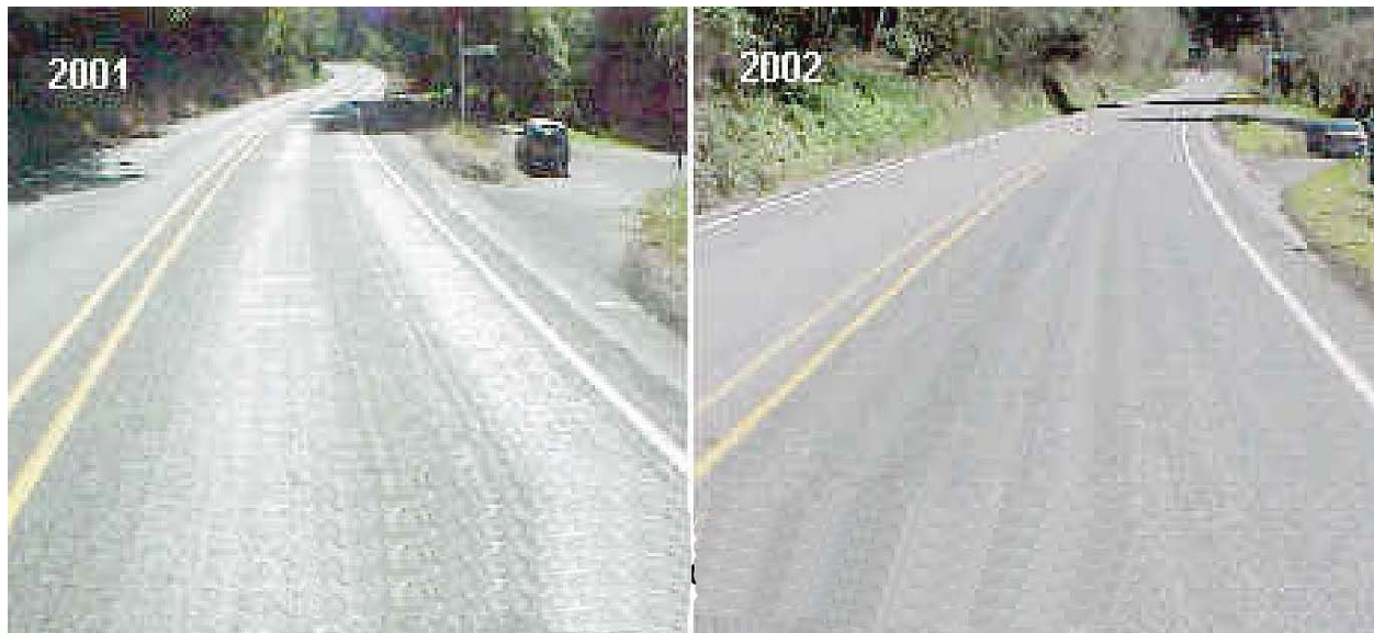
Fotografía 1. Carretera antes y después de un T.S.B.

Tratamiento superficial múltiple: Dos o tres TSB colocados uno encima del otro. El tamaño máximo del agregado de cada tratamiento sucesivo es corrientemente la mitad del tamaño del agregado colocado previamente, y el espesor total es casi el mismo que el tamaño nominal máximo del agregado de la primera capa; usualmente el triple produce una capa de pavimento de un espesor hasta de 2,5 cm. Un TSB múltiple constituye un tratamiento más denso e impermeabilizante que uno de capa simple, y proporciona al pavimento alguna resistencia.