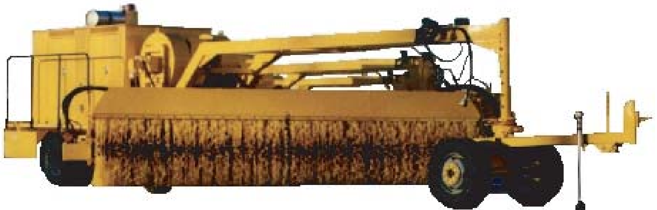
Fotografía 7. Barredora mecánica

El agregado seleccionado, sin embargo, deberá cumplir ciertos requerimientos de tamaño, forma, limpieza y propiedades superficiales.