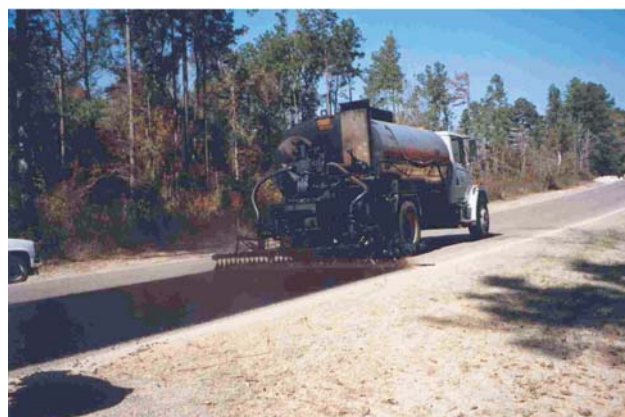
Fotografías 2 y 3. Distribuidor de asfalto