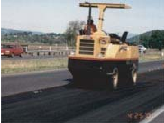
Fotografía 6. Compactador llanta de hule

Los errores encontrados en las diferentes velocidades se tabulan o plotean en un gráfico, de manera que puedan ser fácilmente corregidos cuando se usa el distribuidor.