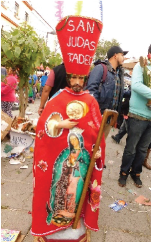
FIGURA 1 SAN JUDAS “CHINELO”

Fuente: Fotografía tomada por Thania S. Álvarez Juárez (28/10/2016).