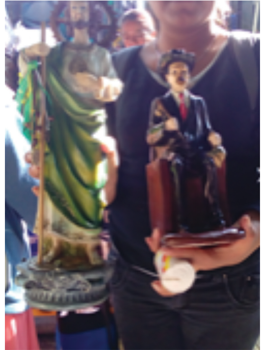
FIGURA 2 SAN JUDAS Y SAN SIMÓN

Fuente: Fotografía tomada por Thania S. Álvarez Juárez (29/10/2016).