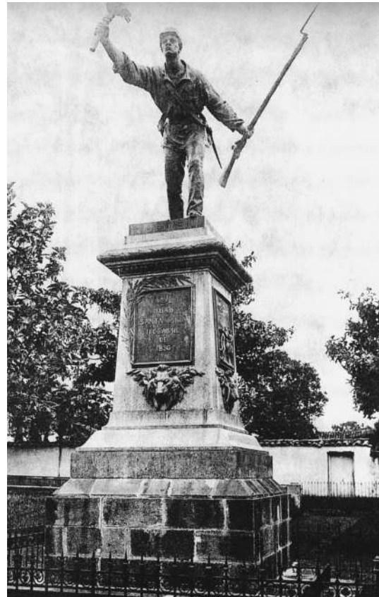
Fig. 2. Monumento a Juan Santamaría. Aristide Croizy. Bronce, 1891. Alajuela.

republicanas; y la tea en la otra, pero que no sea nunca la tea de la discordia y de la guerra civil, sino á veces el mechón que incendia en defensa de la Patria, y á veces la antorcha de la Libertad, ante cuya luz se desvanezca, como sombras de la noche, en la conciencia nacional, todo espíritu incompatible con nuestras instituciones, y con la emancipación que, en todo sentido, ellas provocan y garantizan 22 .