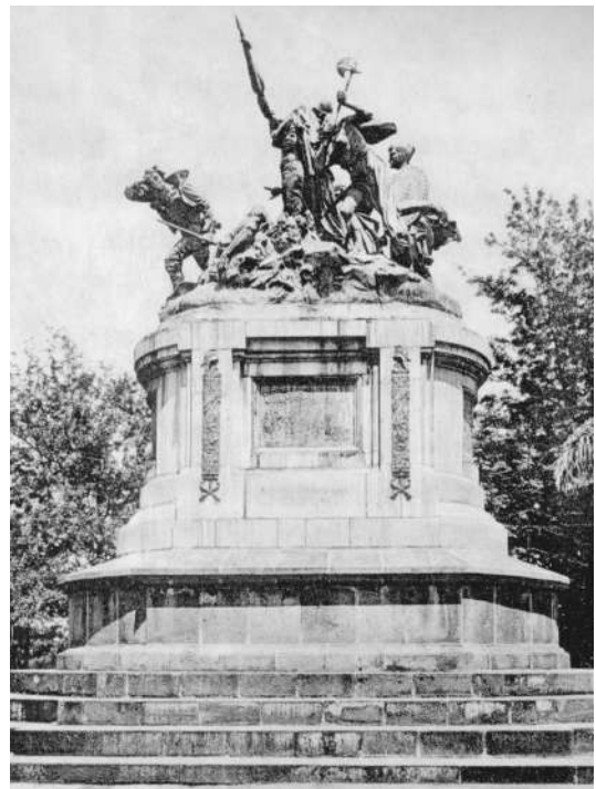
Fig. 3. Monumento Nacional. Louis-Robert Carrier Belleuse. Bronce, 1895. San José.

Con ello queda claro que la Campaña Nacional y la figura de Juan Santamaría se