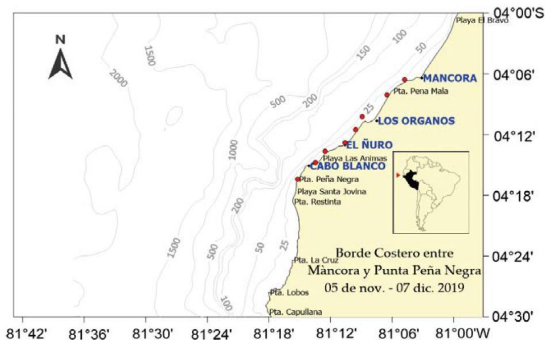
Figura 1. Caletas de El Ñuro y Los Órganos en la costa peruana