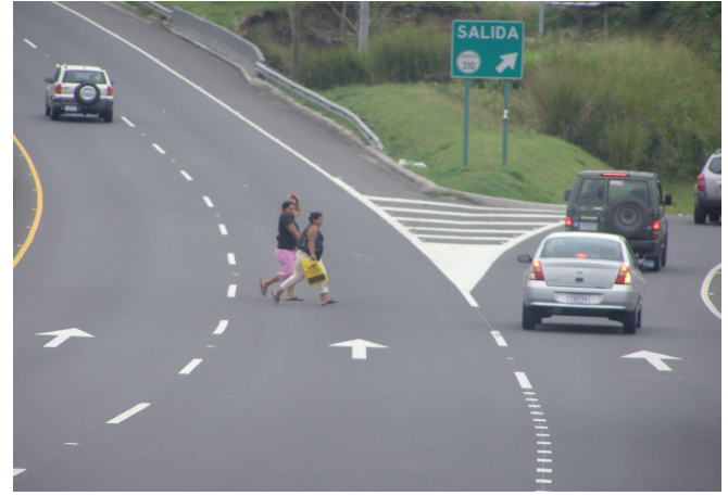
Figura 3. Peatones cruzando en condiciones inseguras, intercambio de Guachipelín.

a cada uno de los tipos de accidentes analizados previamente. Si bien en Costa Rica no existe un costo económico o social asociado a accidentes con fallecidos, heridos de gravedad o heridos leves, la aplicación de este método busca homogenizar el daño equivalente de cada tipo de accidente según su severidad. Lo anterior, con el objetivo de dar atención prioritaria al tipo de accidente con mayor daño equivalente en la ruta de estudio y así poder establecer un orden de priorización de inversión de recursos en seguridad vial.