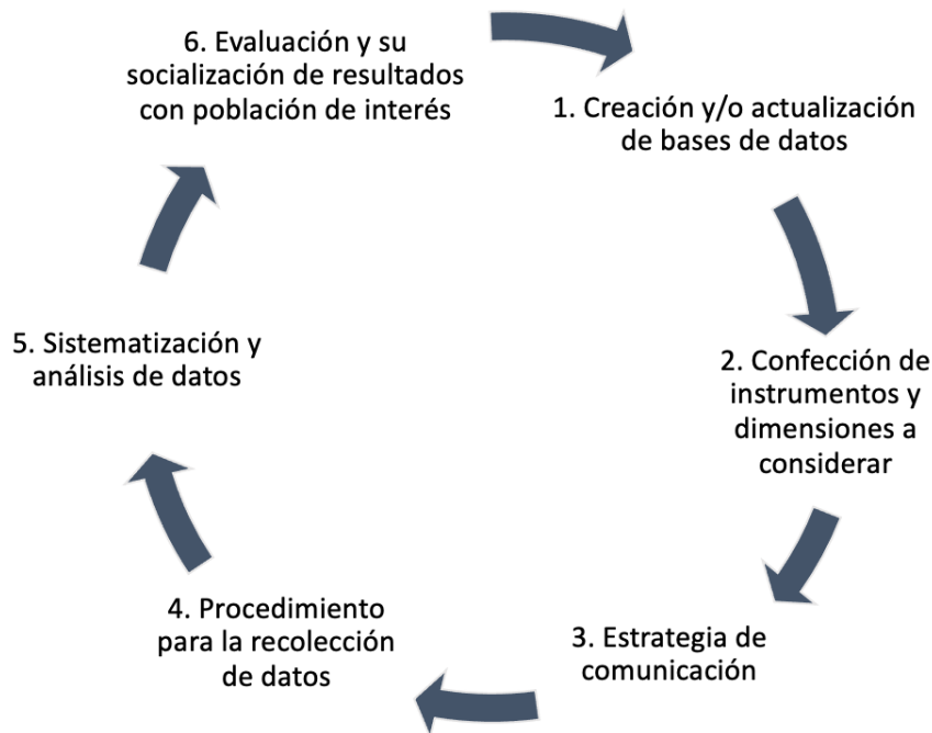
Figura 3. Ciclo para la gestión del seguimiento a personas graduadas y egresadas.

interés. Para finalizar este apartado metodológico se presenta, a modo de ciclo, el proceso de gestión para el seguimiento a personas graduadas y egresadas (Figura 3).